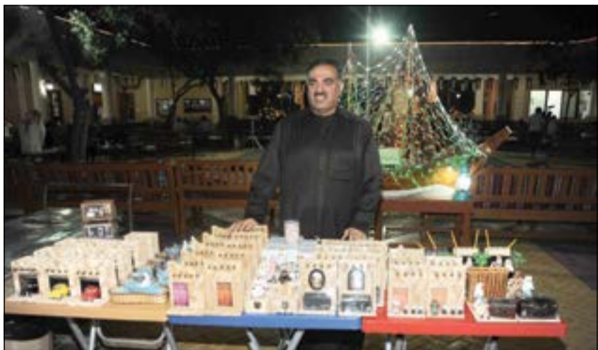
لحد الاجتحة المشاركة