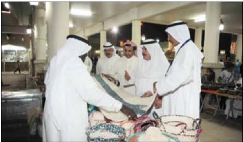
جانب من الجولة