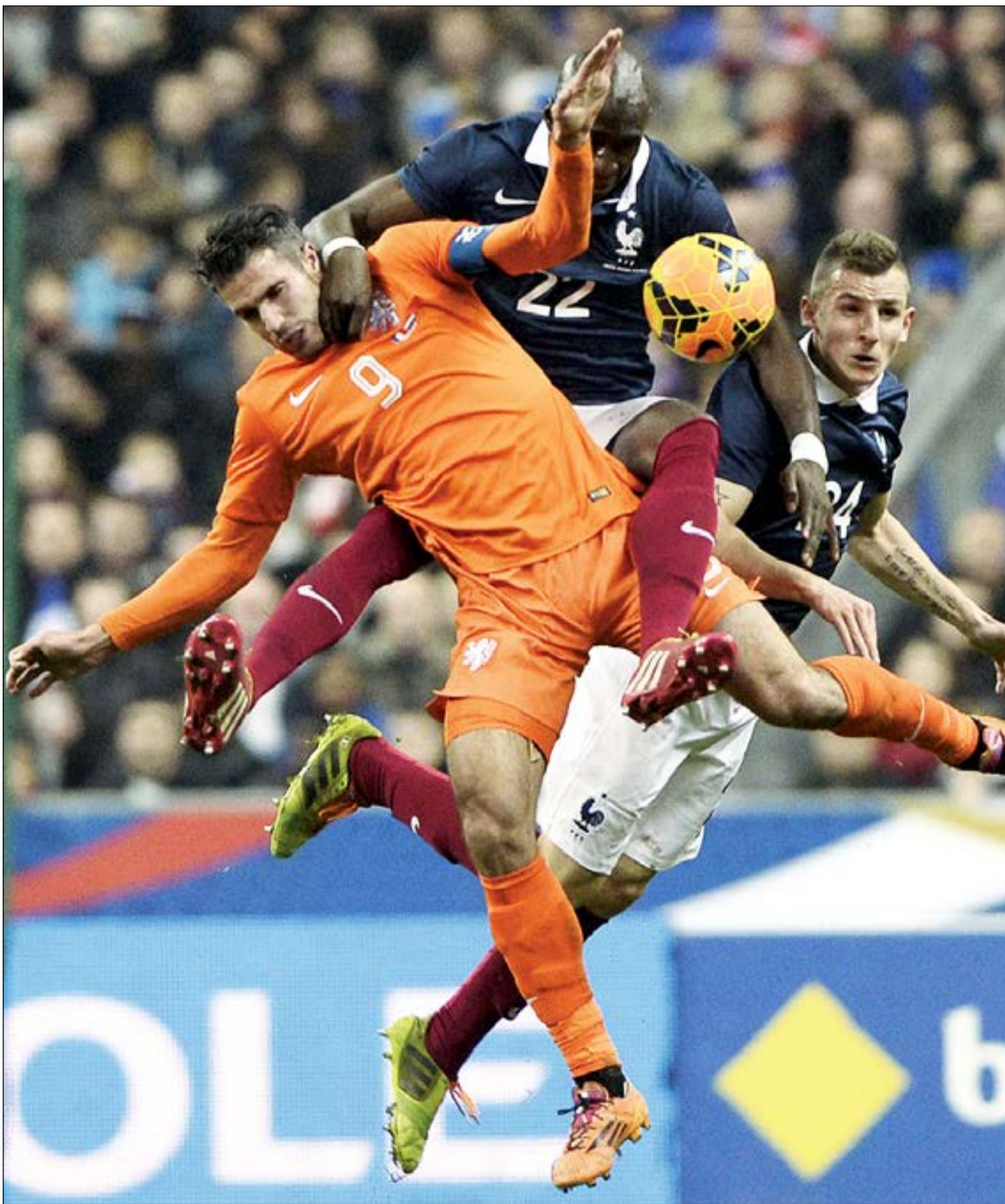
صراع عنيف على الكرة بين فان بيرسي والمدافع الفرنسي مانغالا

كشف المهاجم الألماني المخضرم ميروسلاف كلوزة أن إدارة ناديه لاتسيو الإيطالي عرضت عليه تجديد عقده الذي ينتهي الصيف المقبل، ولكن بشرط تخفيض راتبه للنصف. وأشار كلوزة في حديث لصحيفة «بيلد» الألمانية أنه لم يحسم قراره بعد، خاصة أنه يتقاضى (2,5) مليون يورو، وما زال يدرس قرار الموافقة على (1,25) مليون يورو فقط، بالنظر لوجود عدة عروض وعدم تفكيره بالاعتزال قبل عامين، وحول مونديال البرازيل، أكد كلوزة أنه سيعلمن اعتزاله دوليا بعد المونديال.