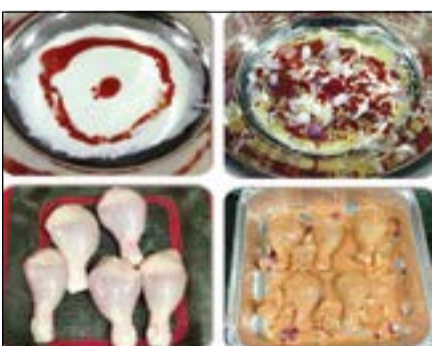
من تتبيلات فيصل

شهرية في الطلبات بنسبة 40% والعوائل على الطلبيات من 20 الى 30%. وبعد أن رأى الإقبال على تتبيلاته، أخذ الزيدان