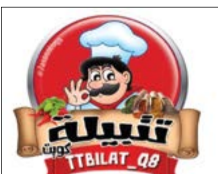
شعار «تتبيلات»، فيصل