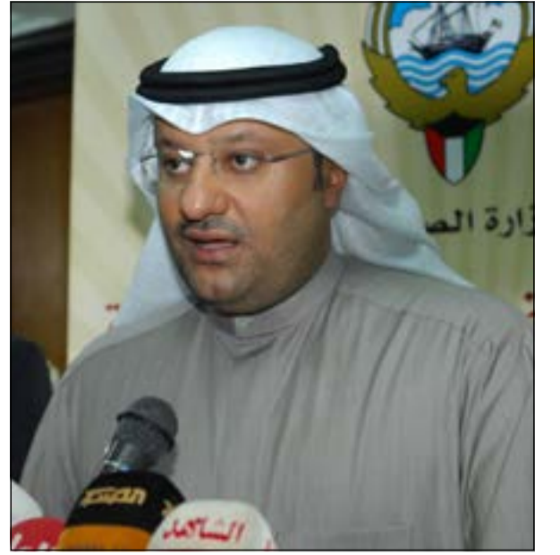
د.علي العبيدي متحدثا

وزير الصحة أكد أنها تجري 5500 سونار و1600 فحص بالمجهود و1000 هولتر كل عام