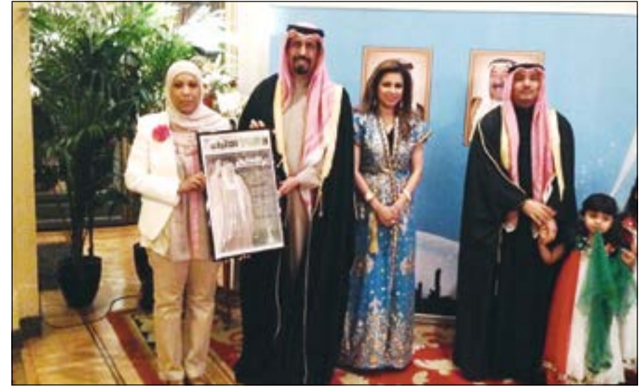
السفير الشيخ علي الخالد يتسلم إصدار «زعيم للإنسانية» من الزميلة نوب العياضي