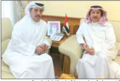
الشيخ عزام الصباح معزيا السفير الإماراتي لدى البحرين