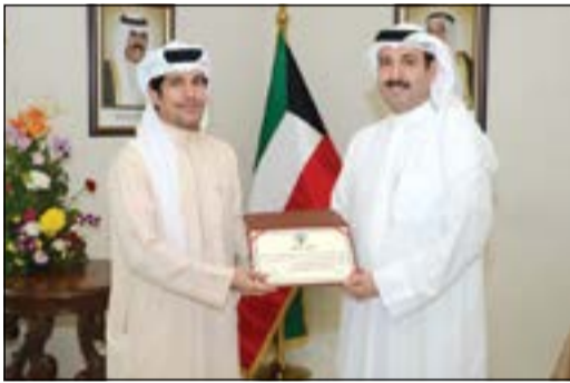
ذياب الرشيدي يكرم أحمد المنصوري

دبي - كونا: قام قنصلنا العام في إمارة دبي والإمارات الشمالية ذياب فرحان الرشيدي بتكريم عدد من مسؤولي مؤسسة دبي للإعلام لدورها والقنوات المنصوية تحتها في تغطية احتفالات الكويت بأعيادها الوطنية خلال شهر فبراير الماضي.