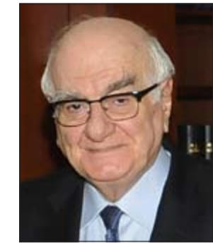
وزير الإعلام رمزي جريج

وأضاف: ساجتمع مع المجلس الوطني للإعلام والذي هو مجلس استشاري وأريد أن تأخذ رأيه وساجري اتصالات بوسائل الإعلام وأطلب منهم أن يضعوا المصلحة العامة نصب أعينهم وتغليبها على المصالح الأخرى وتابع: اليوم ادافع عن مقام رئاسة الجمهورية وعلمت من وسائل الإعلام نفسها أنه جرى طلب من وزير العدل للنيابة العامة أن تتحرك، فانا لا أتدخل في شؤون القضاء فالقضاء عندما يرى أن يتحرك لحماية مقام الرئاسة فانا لا أعلق على ذلك، لكنني اتفهم موقف وزير العدل. وردا على سؤال عن معنى وصف الرئيس سليمان للمقاومة بالمعادلة الخشبية. قال: هذا شعار وأنا لا أريد التوقف عند العبارات المستعملة، علما بأن الرئيس ذكر بإعلان بعيدا حرية حظى بموافقة جميع الأطراف بما فيها حزب الله