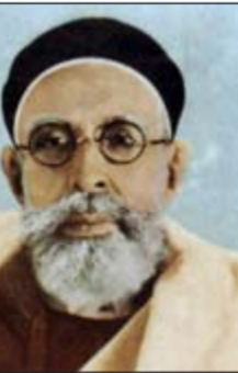
محمد إدريس السنوسي

طرابلس - وكالات: أصدر مجلس الوزراء الليبي قرارا بشأن رد الاعتبار للملك الراحل محمد إدريس السنوسي، وعودة الجنسية الليبية له ولأسرته وكذلك حصر الأملاك الخاصة به وبأسرته وإرجاعها لورثته. وذكر الموقع الرسمي للحكومة الليبية أمس أن المادة الأولى من القرار تضمنت، تكليف مصلحة الجوازات والجنسية وشؤون الأجانب بتصحيح سجلاتها فيما يخص الملك وأسرته وإعادة الجنسية الليبية لهم. كما تضمنت المادة، تكليف