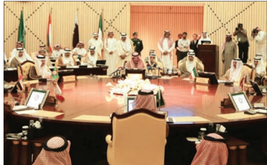
الشيخ صباح الخالد مترسدا اجتماع المجلس الوزاري لدول مجلس التعاون

وأضاف «وكان وجدونا الأمل بان تشكل تلك المفاوضات خطوة للتوصل الى تسوية سياسية في سورية بناء على المقررات والمبادئ التي وردت في مؤتمر جنيف 1 باعتبارها اطارا دوليا مناسباً لتنفيذ عملية انتقال سلمي للسلطة في سورية».