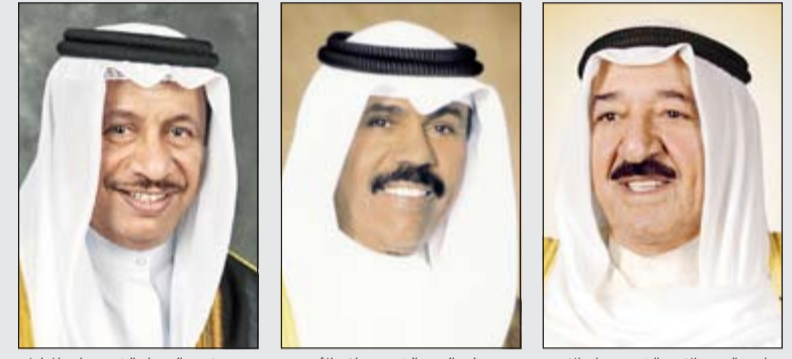
صاحب السمو الأمير الشيخ صباح الأحمد سمو ولي العهد الشيخ نواف الأحمد سمو رئيس الوزراء الشيخ جابر المبارك

أقرّ مجلس الأمة المرسوم بقانون رقم 134 لسنة 2013 بشأن تعديل بعض أحكام المرسوم بقانون رقم 42 لسنة 1978 في شأن الهيئات الرياضية وذلك بأغلبية أعضائه. ووافق المجلس على اقتراح نياي بشأن الطلب من لجنة الشؤون المالية والاقتصادية تقديم تقريرها حول التعديل على قانون صندوق الأسرة في جلسة 11 مارس الجاري، كما أقر الطلب من اللجنة ذاتها تقديم تقريرها حول الاقتراح بقانون بخصوص التعديل على قانون صندوق التعثرين في الجلسة نفسها. ووافق المجلس على طلب الحكومة سحب تقرير لجنة الشؤون التشريعية والقانونية البرلمانية بشأن المشروع واقتراح بقانون بتعديل بعض أحكام القانون رقم 88 لسنة 1995 بشأن محاكمة الوزراء وإرجاعه إلى اللجنة للتوافق على بنوده على أن يقدم في جلسة المجلس المقرر عقدها في 11 مارس الجاري. وقال وزير العدل ووزير الأوقاف والشؤون الإسلامية د.نايف العجمي خلال مناقشة المجلس لقانون محاكمة الوزراء: إن المشروع عندما عرض في الجلسة السابقة عارضته الحكومة ولم تسحبه «تعاوناً مع المجلس وإعادته إلى اللجنة المختصة حتى يأخذ حقه في النظر». • التفاصيل 14-17