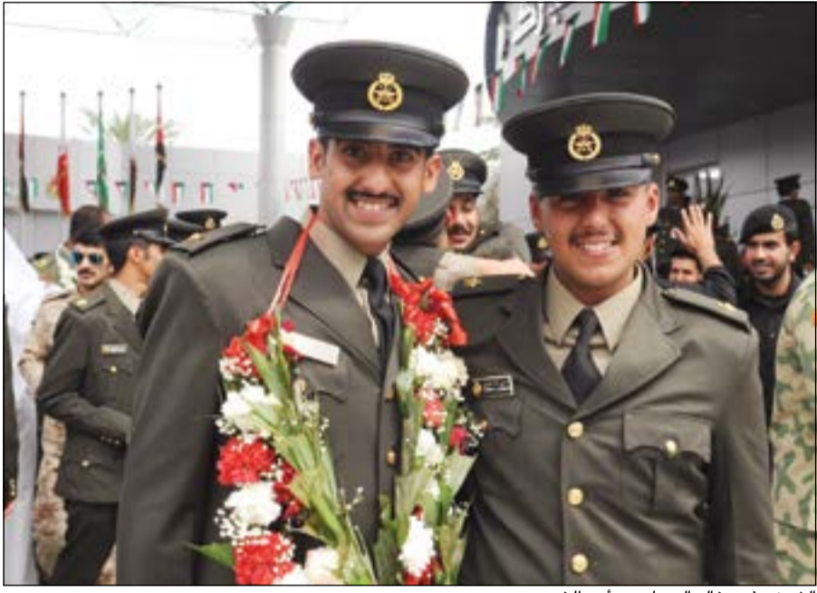
الشيخ عذبي خالد الصباح مع أحد الخريجين