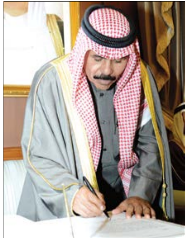
سمو نائب الأمير يسجل كلمة في سجل الكلية