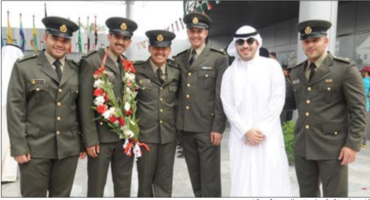
الشيخ عذبي خالد الصباح متوسلاً بمجموعة من الخريجين