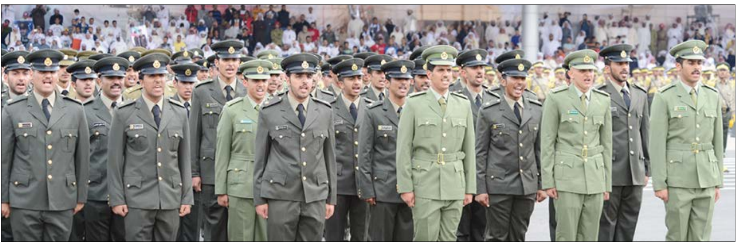
الخريجون خلال أداء اليمين القانونية