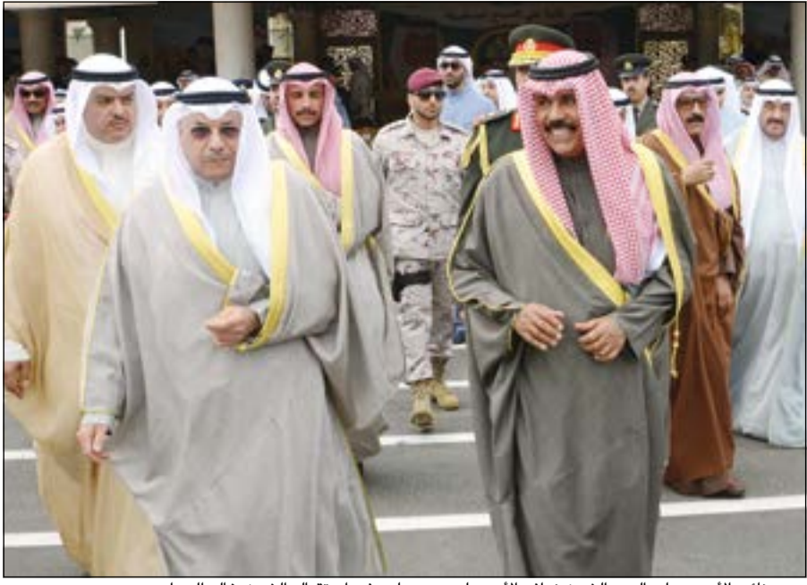
سمو نائب الأمير وولي العهد الشيخ نواف الأحمد لدى وصوله وفي استقباله الشيخ خالد الجراح