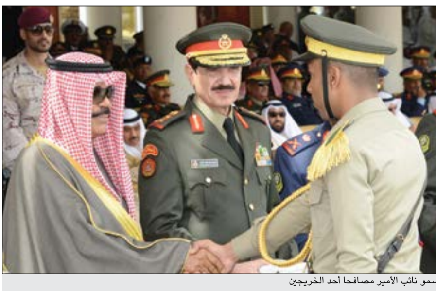
سمو نائب الأمير مصافحا أحد الخريجين

عبدالهادي العجمي تحت رعاية صاحب السمو الأمير الشيخ صباح الاحمد القائد الاعلى للقوات المسلحة وبحضور سمو نائب الأمير وولي العهد الشيخ نواف الأحمد، أقيم صباح أمس حفل تخريج الدفعة الثامنة عشرة والطلبة الضباط من الدفعة الواحدة والأربعين وذلك بكلية علي الصباح العسكرية. ووصل موكب سمو نائب الأمير إلى مكان الحفل، حيث استقبل بكل حفاوة وترحيب من نائب رئيس مجلس الوزراء وزير الدفاع الشيخ خالد الجراح ورئيس الأركان العامة للجيش الفريق الركن عبدالرحمن العثمان ووكيل وزارة الدفاع جيسار الجيسار ومدير كلية علي الصباح العسكرية وأعضاء مجلس الدفاع العسكري وقيادات الكلية. شهد الحفل رئيس مجلس الأمة مرزوق الغانم ورئيس مجلس الأمة السابق جاسم الخرافي وكبار الشيوخ وسمو الشيخ ناصر المحمد وسمو رئيس مجلس الوزراء الشيخ جابر المبارك والنائب الأول لرئيس مجلس الوزراء وزير الخارجية الشيخ صباح خالد الخالد ووزير شؤون الديوان الأميري الشيخ علي الجراح