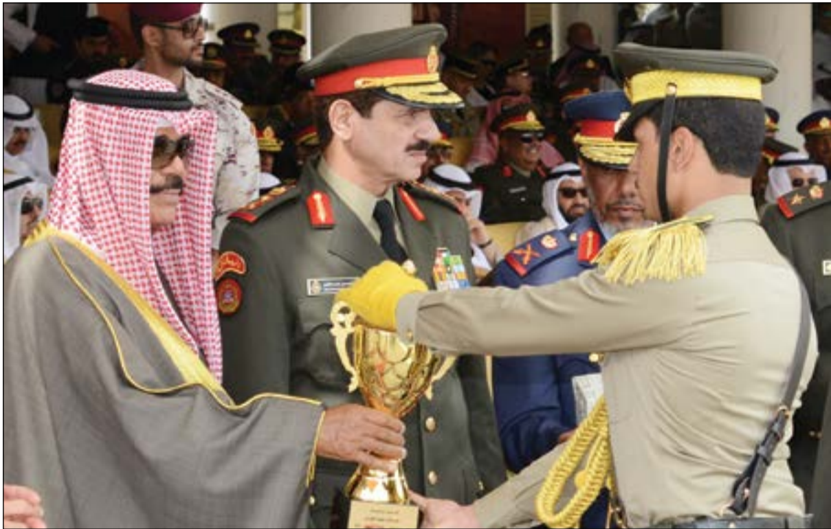
سمو نائب الأمير يسلم الكأس لأحد الخريجين