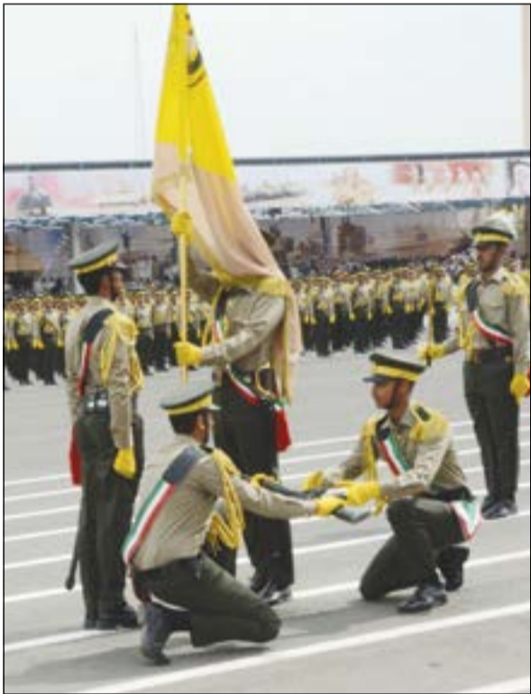
عمليات تسليم وتسلم علم كلية علي الصباح العسكرية بين دفعتي الطلبة الضباط