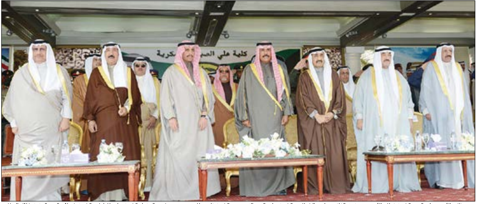
سمو نائب الأمير وولي العهد الشيخ نواف الأحمد ومرزوق الغانم وجاسم الخرافي والشيخ جابر العبد الله وسمو الشيخ ناصر المحمد وسمو رئيس الوزراء الشيخ جابر المبارك والشيخ شعلان العبد العزيز خلال الحفل

تحت رعاية صاحب السمو وبحضور رئيس مجلس الأمة وكبار الشيوخ والوزراء