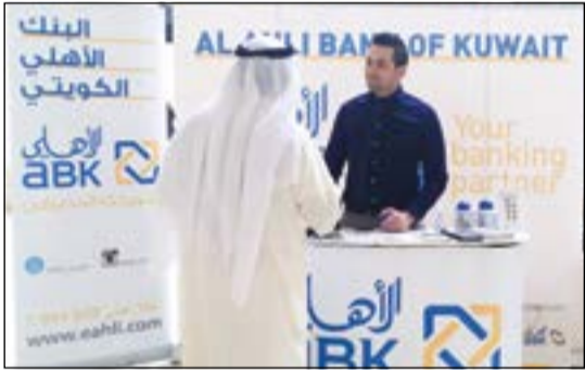
جناح البنك في وزارة الأشغال

يقدم البنك الأهلي الكويتي العديد من الخدمات المصرفية بميزات حصرية للعملاء، حيث يتواجد البنك في وزارة الأشغال حتى يوم الخميس 2014/3/6 للتعريف بمنتجاته وتقديم خدماته المصرفية للموظفين وعرض أهم الميزات التي يحصلون عليها عند القيام بتحويل الراتب أو إصدار أي من بطاقات الأهلي الائتمانية. الجدير بالذكر أن البنك الأهلي الكويتي يقدم مجموعة من الهدايا والخدمات المجانية عند تحويل الراتب، أو لائها هدية نقدية 100 دينار (أو ميزات تصل إلى 2000 دينار) وبطاقة فيزا الأهلي الذهبية الائتمانية مجانا للمستهة الأولى وتأمين سفر مجاني ودفتر شيكات مجاني