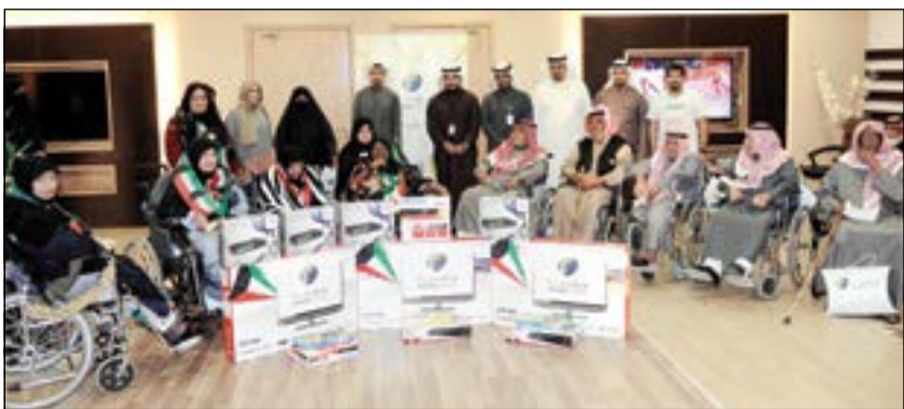
موظفو البنك يشاركون فرحة دار المسنين بالأعياد الوطنية

العمرية، من منطلق حرص البنك على تنظيم نشاطات تحمل أبعادا إنسانية تحاكي في مضامينها مبادئ الدين الإسلامي الحنيف، التي لطالما حرص بنك وربة على مراعاتها خلال مسيرته العملية والاجتماعية على حد سواء. وقد اختتم فريق عمل «وربة» الزيارة بتقديم مجموعة متنوعة من الهدايا القيمة للمسنين، عرفانا منهم بجميل كبار السن في تنشئة الأجيال الواعدة، وتقوية لأواصر التواصل بين كل شرائح المجتمع. ضمن جو أسري ملؤه التمنيات بأن يمن الله على كل المسنين بطول العمر ودوام الصحة.