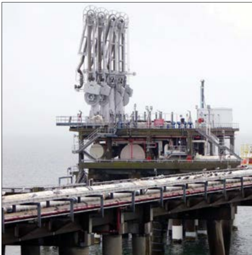
يبدو ان النفط من القطاعات المستفيدة من التوترات السياسية بين روسيا و أوكرانيا حيث قفزت اسعار النفط امس لاكثر من دولارين ومحمتم استمرارها في الارتفاع.. في الصورة مصفاة تكرير نفطية

كما هي الحال في كل مرة، يتم ربط هبوط البورصة الكويتية بالأحداث العالمية، وكان السوق كانت مرتفعة بشكل كبير كما هي الحال في بورصات اقليمية، حتى يتم تعليق هبوطها أمس بنحو 147 نقطة على شماعة الازمة الروسية - الأوكرانية المتفاقمة. في الواقع، يكون مفهوما ما حدث من هبوط جماعي للبورصات الخليجية الأكثر ارتباطا بالعالم كبورصة دبي على سبيل المثال، لكن يستبعد أن تكون هناك علاقة مباشرة بين الهبوط الجزري للبورصة الكويتية مع الأحداث العالمية. ولم تتفاعل البورصة الكويتية مع كل الصعود الذي حدث للبورصات الخليجية منذ شهر أكتوبر الماضي، علما إن التصحيح الذي تعيشه هذه البورصات لم يكن مفاجئا، حتى صندوق بلاك روك (أكبر شركة لإدارة الأصول بالعالم) أعلن قبل اسابيع عن خروجه من بورصة دبي لأن الأسعار ارتفعت بشكل مبالغ فيه. اما في السوق الكويتية، فيمكن قراءة ما يجري كالتالي: ● كما بات معروفا أن السوق ارتفعت في بداية العام الماضي على اثر المضاربات العشوائية التي احدثها بعض المضاربين وتركزت في اسهم صغيرة الحجم، ولم يكن ارتفاع البورصة صحيحا، بدليل هبوطه بشكل قوي منذ شهر يونيو العام الماضي. ● حاصرت هيئة اسواق المال المضاربة الضارة عن طريق توقيف الملاعبين بالاسهم ومنعهم من التداول، وبدأت السوق تصحيح نفسها، وربما ما زالت حتى الآن في موجة تصحيح التي ستفتح بلا شك فرصا لكثيرين في حال استقرت الاسعار عند مستوى معين.