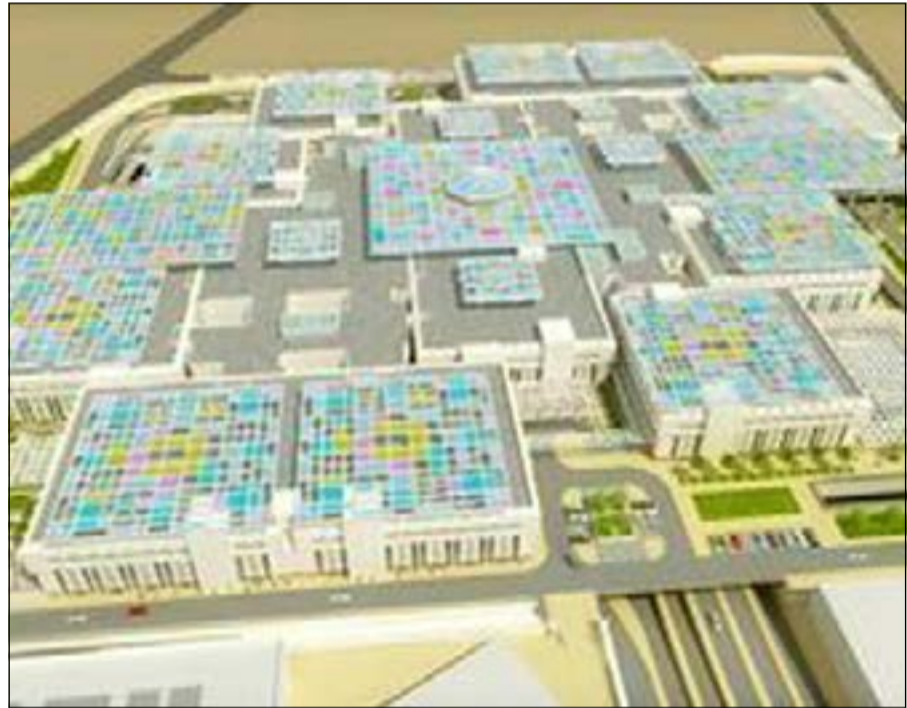
مجمع تطوير مجمع الوزارات

في الاعتبار ترشيد النفقات التشغيلية للمبنى، ورفع كفاءة المبنى وخدماته بما يحقق إطالة عمره الافتراضي. وأكدت في تغريداتها انه سيتم تنفيذ المشروع أثناء التشغيل الكامل لمبنى مجمع الوزارات حتى لا يتأثر العمل بمبنى المجمع أثناء التنفيذ.