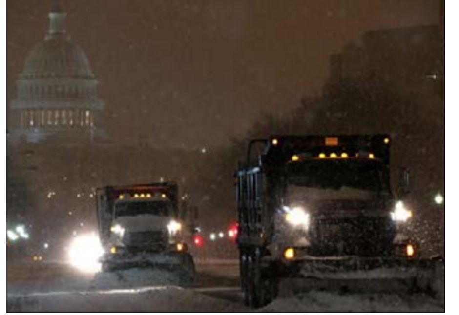
كاسحات ثلج تزيل الثلوج من طرقات العاصمة واشنطن

رويترز: قال مسؤولون إن المكاتب الاتحادية في منطقة العاصمة الأمريكية واشنطن أغلقت أمس أمام الجمهور والموظفين غير الأساسيين بسبب عاصفة شتوية قوية تتجمع عند الساحل الشرقي للبلاد. وأجلت أيضا عمليات تصويت كانت مقررة أمس في مجلسي النواب والشيوخ بسبب العاصفة التي تتوقع هيئة الأرصاد الجوية أن