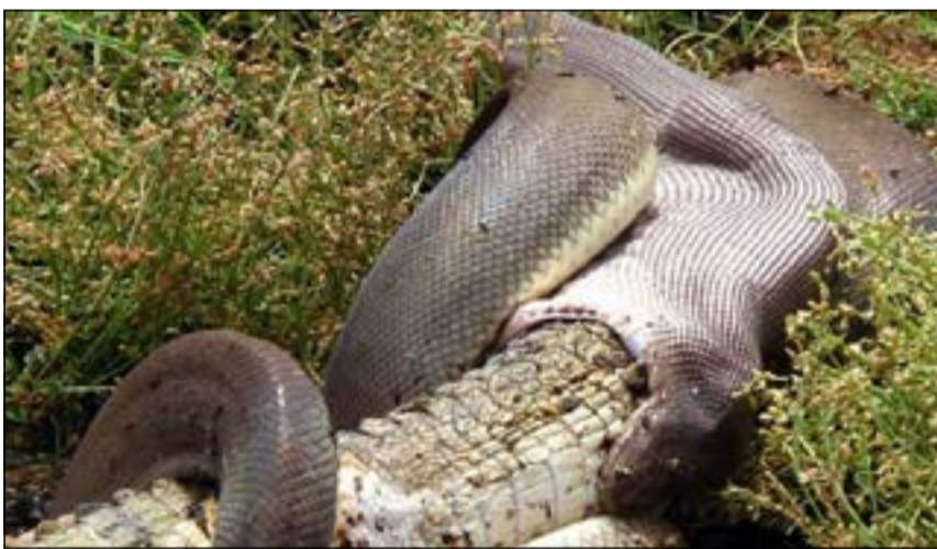
الأفعى مع بداية صراعها مع التمساح