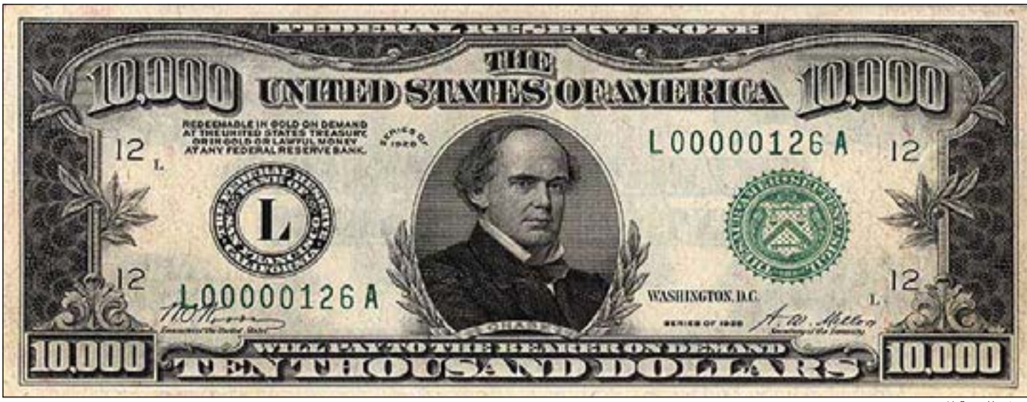
نموذج للورقة المزورة