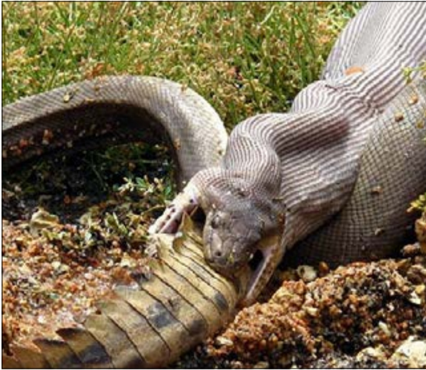
.. والأفعى بعد أن بدأت تلتهم وجبتها