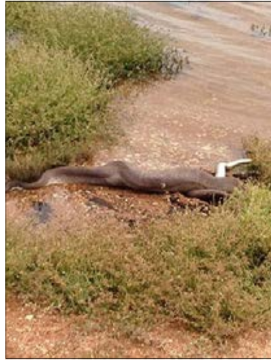
التمساح وقد اختفى تماما بعد ان ابتلعته الأفعى