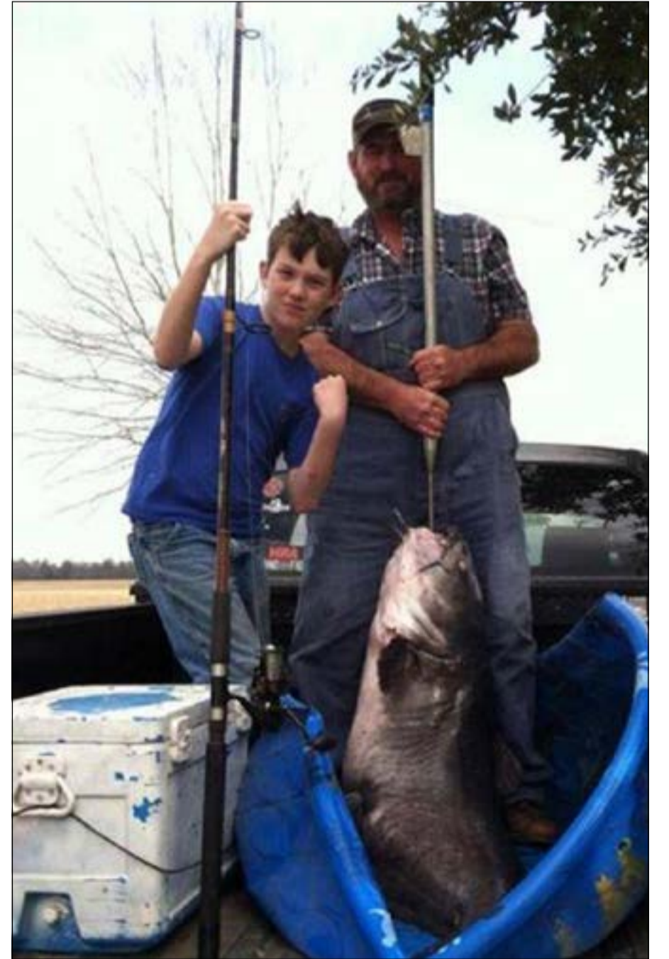
الصبي مع والده يستعرض صيده الثمين

بويت من لويزيانا كان في رحلة صيد مع أسرته في النهر، عندما اصطاد السمكة الكبيرة التي تزن أكثر من 57 كيلوغراما. يذكر أن هذه السمكة حطمت الرقم القياسي الذي سجل في العام 2005، حيث بلغ وزن السمكة 49,9 كيلوغراما.