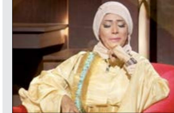
.. وهي تبكي في البرنامج