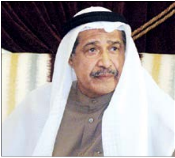
الفنان القدير جاسم النبهان