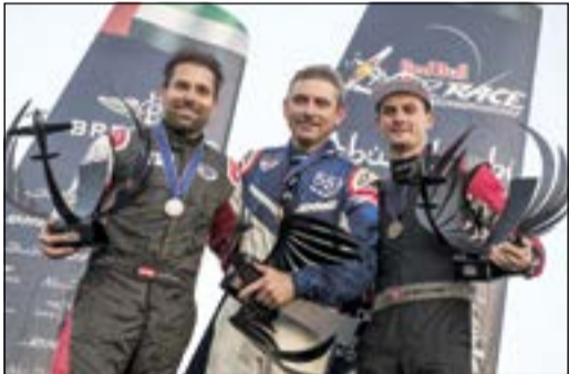
بونهوم على منصة التتويج