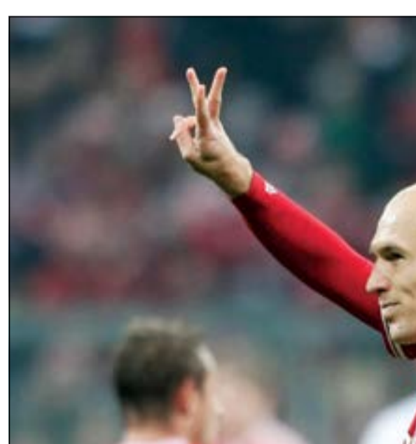
الهولندي روبن سعيد بـ «الهاتريك» الذي أحرزه في شباك شالكه

وتغلب نيوكاسل يونايتد على مضيفه هال سيتي بأربعة اهداف للفرنسيين