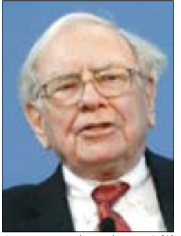
الملياردير وارين بافيت

في شركة هايبنز للصناعات الغذائية. وينصح بافيت منذ زمن بعيد بتنويع الاستثمارات في القطاعات الأساسية التي يمكن أن تعزز الإيرادات بشكل مطرد في المدى الطويل.