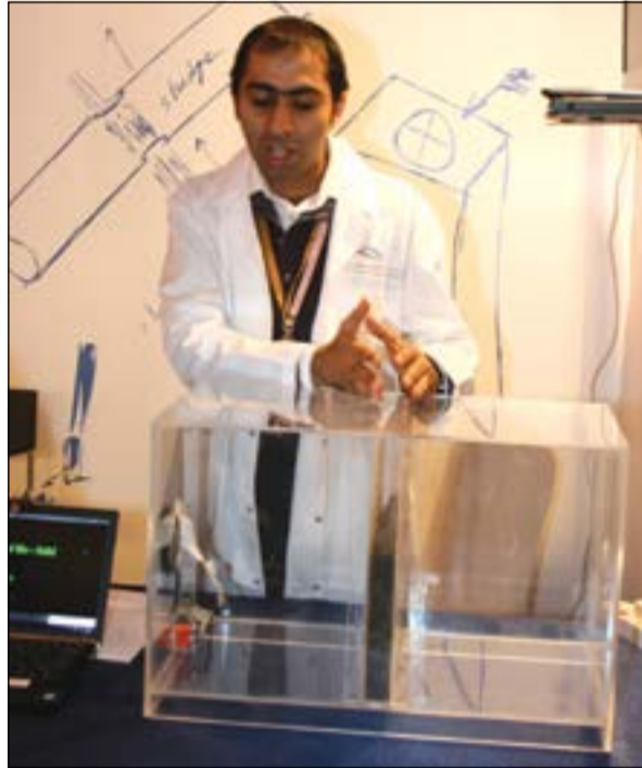
... ويقدم شرحاً عن الحماة الجافة

فهذا الترميم يمكن أن يتم بالإسمنت البيئي، كما أن هناك منشآت يتم بناؤها في المناطق المجاورة للمصانع ويمكن أن يعتمد فيها هذا المنتج.