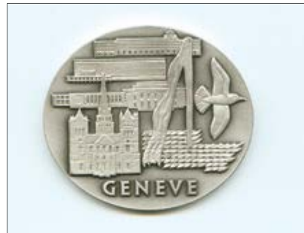
ميدالية فضية في معرض جنيف