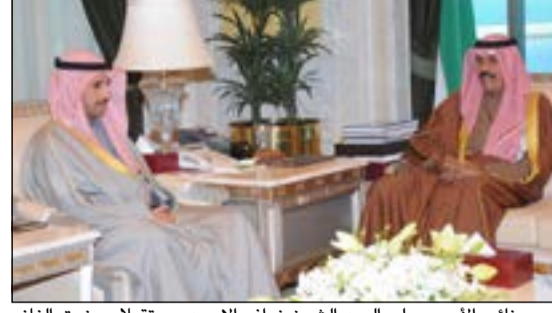
سمو نائب الأمير وولي العهد الشيخ نواف الاحمد مستقبلا مرزوق الغانم

استقبل سمو نائب الأمير وولي العهد الشيخ نواف الاحمد في ديوانه بقصر السيف صباح أمس رئيس مجلس الأمة مرزوق الغانم. واستقبل سموه سمو رئيس مجلس الوزراء الشيخ جابر المبارك. واستقبل سمو نائب الأمير وولي العهد بقصر السيف صباح أمس النائب الأول لرئيس مجلس الوزراء ووزير الخارجية الشيخ صباح الخالد. واستقبل سموه نائب رئيس مجلس الوزراء ووزير الداخلية الشيخ محمد الخالد. كما استقبل سمو نائب الأمير وولي العهد الشيخ نواف الاحمد بقصر السيف أمس نائب رئيس مجلس الوزراء ووزير الدفاع الشيخ خالد الجراح. واستقبل سموه بقصر السيف أمس وزير الإعلام ووزير الدولة لشؤون الشباب الشيخ سلمان