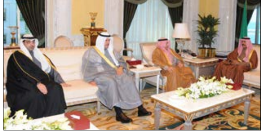
سمو نائب الأمير وولي العهد الشيخ نواف الاحمد خلال استقباله الشيخ خالد الجراح والشيخ سلمان الحمود والشيخ محمد العبدالله

استقبل سمو نائب الأمير وولي العهد الشيخ نواف الاحمد في ديوانه بقصر السيف صباح أمس رئيس مجلس الأمة مرزوق الغانم. واستقبل سموه سمو رئيس مجلس الوزراء الشيخ جابر المبارك. واستقبل سمو نائب الأمير وولي العهد بقصر السيف صباح أمس النائب الأول لرئيس مجلس الوزراء ووزير الخارجية الشيخ صباح الخالد. واستقبل سموه نائب رئيس مجلس الوزراء ووزير الداخلية الشيخ محمد الخالد. كما استقبل سمو نائب الأمير وولي العهد الشيخ نواف الاحمد بقصر السيف أمس نائب رئيس مجلس الوزراء ووزير الدفاع الشيخ خالد الجراح. واستقبل سموه بقصر السيف أمس وزير الإعلام ووزير الدولة لشؤون الشباب الشيخ سلمان