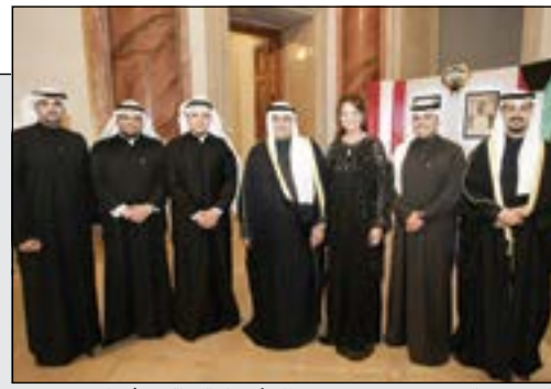
السفير صادق معرفي ورحمه بتوسط أعضاء البعثة في فيينا