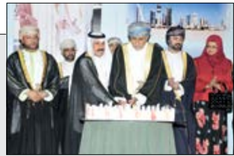
السفير فهد المطيري والشيخ خالد العمري ودرابوية البوسعيدية والشيخ خالد العولي وأصحاب السمو شهاب بن طارق ومحمد بن سالم آل سعيد ومحمد بن ثويبي آل سعيد يقفون بكبة الاحتفال

صادق معرفي: السياسة الحكيمة والمتوازنة للكويت حظيت باحترام وتقدير العالم 10