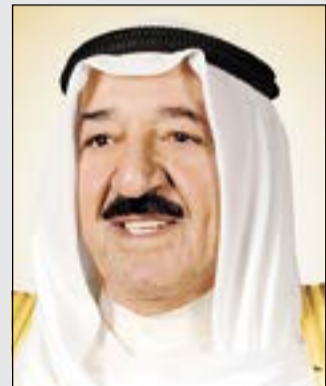
صاحب السمو الامير الشيخ صباح الاحمد

صاحب السمو نائب الأمير لحضور تخريج طلبة كلية علي الصباح الأمير أجرى فحوصات طبية معنادة بأمركا وتلقى اتصالا من ملك البحرين للاطمئنان على سموه