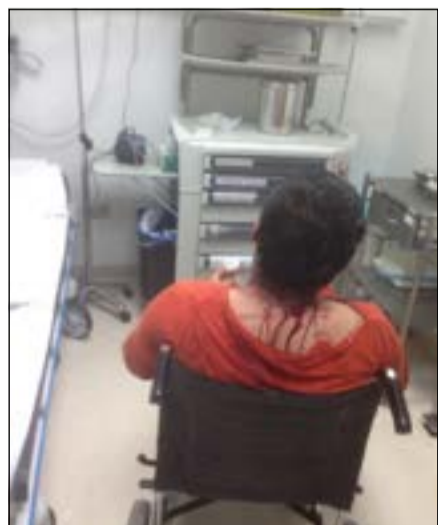
الدماء تنزف من رأس الخليجي