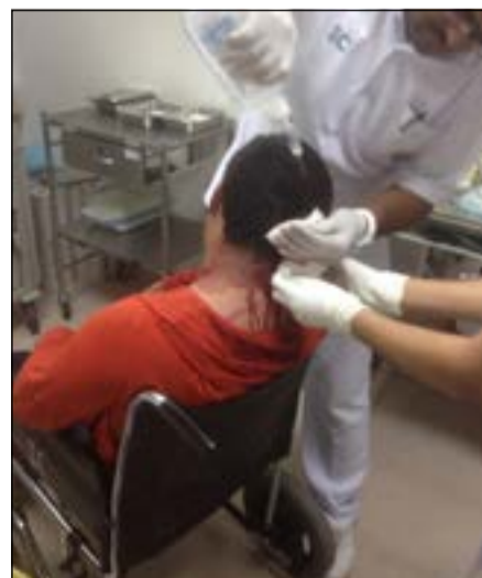
المصاب الخليجي خلال تلقيه العلاج