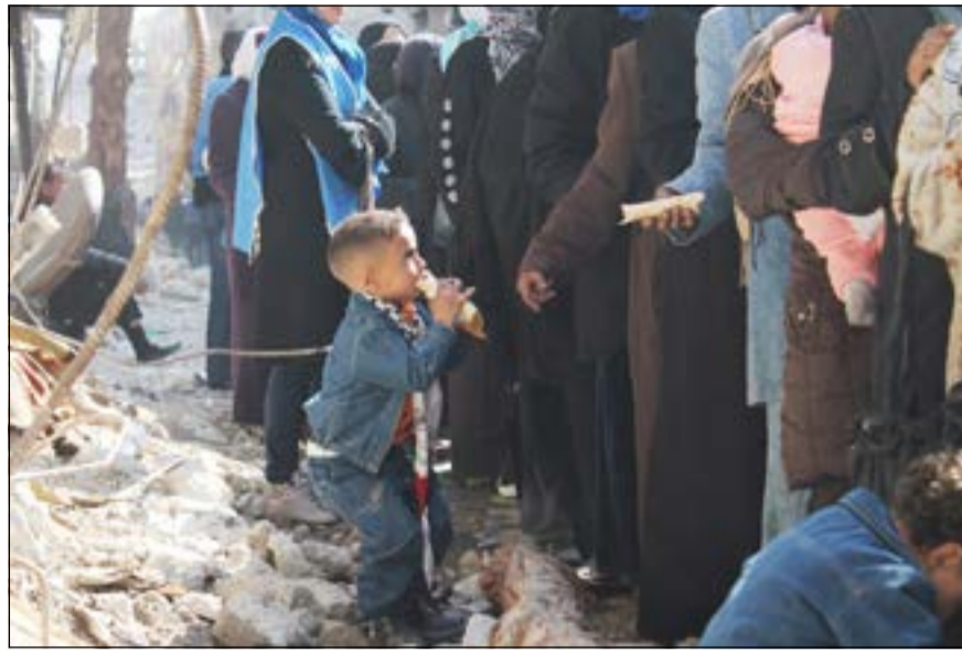
طفل فلسطيني يأكل رغيفاً خلال توزيع المساعدات على أهالي مخيم اليرموك