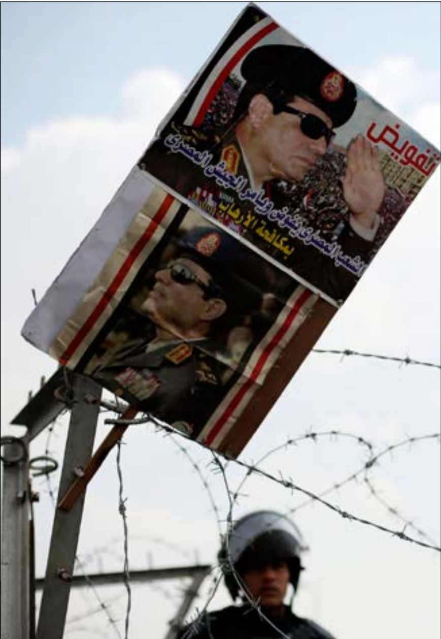
ملصق مؤيد للجيش المصري أمام مقر محاكمة الرئيس المعزول محمد مرسي أمس الأول

التي تجري عليها للتأكد من ملاءمتها من الناحية الصحية للاستخدام من قبل المواطنين. كما أصدر قرارا بإلغاء موكب رئيس مجلس الوزراء أثناء التحركات والاكْتفاء بسيارة واحدة، مشيراً إلى أنه لا يخشى إلا الله وأنه على ثقة في الأمن المصري وعلى ادراك تام لضرورة العمل على استعادة ثقة المواطن.