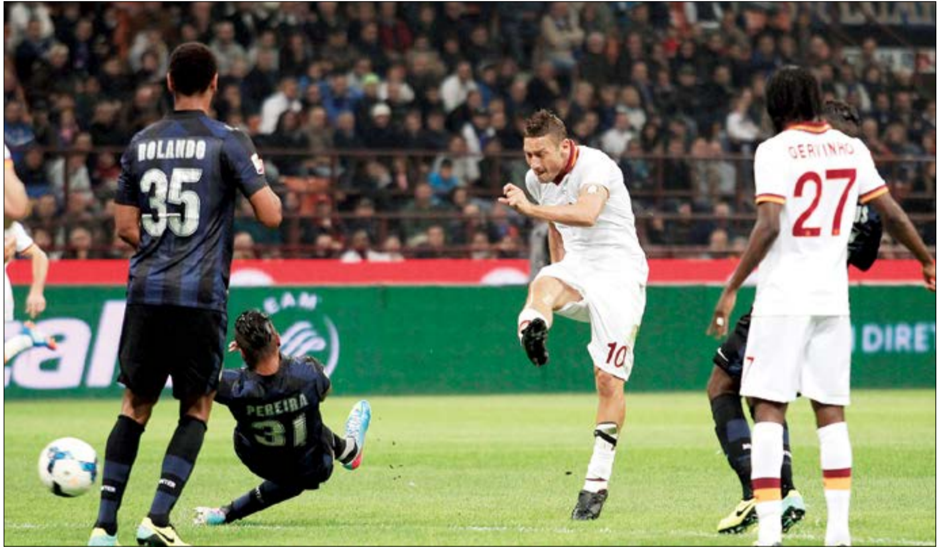
جمامير إنتر ميلان تخشى تألق الملك توتي مجدداً