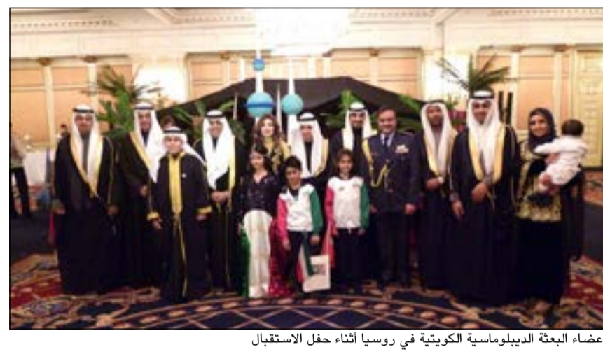
اعضاء البعثة الدبلوماسية الكويتية في روسيا اثناء حفل الاستقبال

كما أقامت سفارتنا لدى البرازيل حفل استقبال في العاصمة برازيليا وذكّرت السفارة في بيان تلقت «كونا» نسخة منه أن السفير عبادة مبرد السعيدى التي في المناسبة كلمة ترحيبية بضيوف الكويت تقدم فيها باسمى آيات التهاني والتبريكات إلى صاحب السمو الامير الشيخ صباح الاحمد وسمو ولي عهده الأمين الشيخ نواف الاحمد وكل المواطنين الكويتيين. وأقامت سفارتنا لدى جمهورية الفلبين حفل استقبال وقال سفيرنا لدى جمهورية الفلبين وليد الكندري انه ألقى خلال الحفل الذي أقيم امس كلمة تقدم فيها باسمى آيات التهاني والتبريكات لمقام صاحب السمو الامير الشيخ صباح الاحمد وسمو ولي العهد الامير الشيخ نواف الاحمد وسمو وزير التعليم مغلح حكومية اندريجان في الحفل والسادة الحضور وشكر الجميع على تلبيةهم للدعوة، مؤكداً استمرار أوامر الصداقة وتعميق العلاقة الثنائية بين البلدين الصديقين والرقى بها إلى أعلى المستويات.