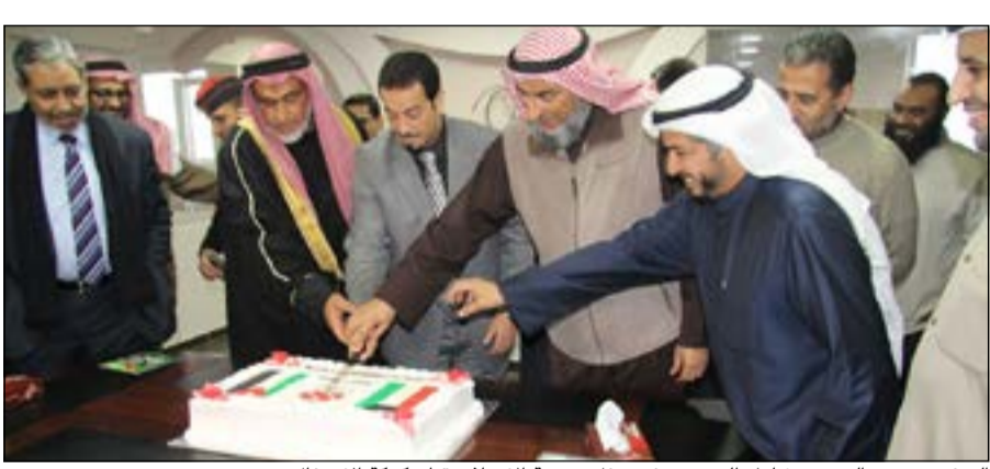
السفير د.حمد الدعيح يشارك الحضور في حفل جمعية الإصلاح قطع كعكة الاحتفال

عمان - «كونا»: احتفلت جمعية الإصلاح الاجتماعي في الأردن بالذكرى الـ 53 للاستقلال والـ 23 للتحرير بحضور سفيرنا لدى الأردن د.حمد الدعيح. حضر الاحتفال الذي يتزامن مع احتفال الجمعية بمرور 25 عاماً على تأسيس مكتب الأردن إلى جانب السفير د.حمد الدعيح الأمين العام للرحمة العالمية بحبي العقيلي وولي العهد جابر المبارك رئيس مجلس الوزراء. وفي كوالالمبور اقامت سفارتنا في اندونيسيا حفلا وذكرت السفارة في بيان أن حضور ابناء شهداء الكويت في هذه المناسبة الوطنية الغالية كان مميّزا في إبراز وجه الكويت الحضاري المشرق من حيث الإعداد والترتيب والأنشطة والذين اصحوا في إبرازها بهذه الاحتفالية.