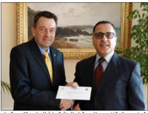
السفير جمال الغنيم مع المدير العام للجنة الدولية للصليب الاحمر الدولي بيتر ماورر

وأوضح أن عدداً من مجالات التعاون المختلفة تم فتحها بين الجانبين على وجه خاص بعد الزيارة التي قام بها سمو رئيس مجلس الوزراء الى نيودلهي في نوفمبر الماضي. وهنأت سفارتنا في بغداد صاحب السمو الأمير الشيخ صباح الاحمد والشعب الكويتي بالبعد الوطني للبلاد وذكرى التحرير. وقالت السفارة في بيان تلقت «كونا» نسخة منه: انه بمناسبة احتفال الكويت بالعيد الوطني الـ 53 وذكرى التحرير الـ 23 ترفع سفارة دولة الكويت لدى جمهورية العراق الشقيق اسمى آيات التهاني والتبريكات لمقام صاحب السمو الامير الشيخ صباح الاحمد وسمو ولي العهد الامير الشيخ نواف الاحمد. وفي موسكو اقام السفير عبدالعزيز العدوانى حفل استقبال، وتمنى العدوانى للكويت وشعبها دوام التقدم والازدهار في ظل قيادتنا الحكيمة، داعياً المولى عز وجل ان يحفظ لكه الكويت وشعبها من كل مكروه، منطلعا لان يشهد هذا العام تطورا في علاقة الكويت وروسيا الاتحادية في جميع المجالات