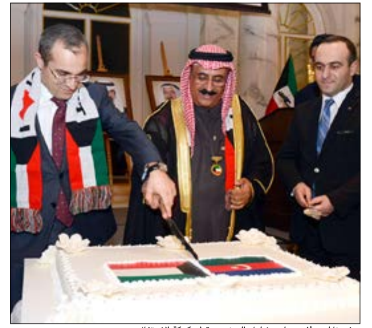
سفيرنا لدى اندريجان يشارك الحضور قطع كعكة الاحتفال