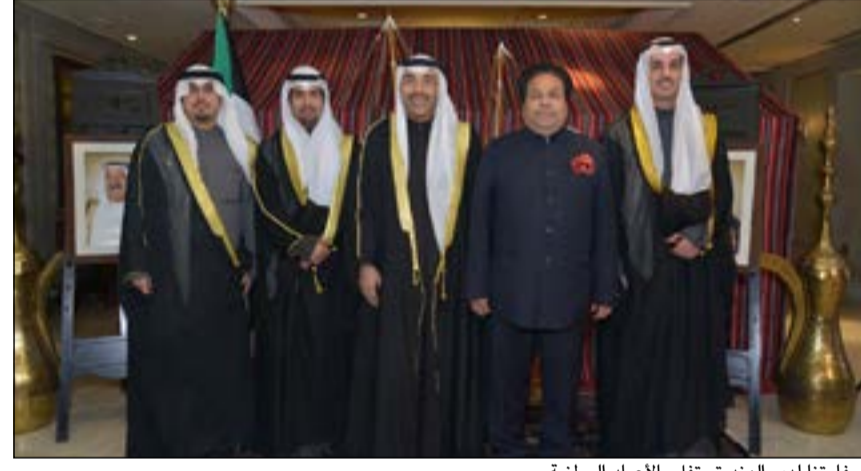
سفارتنا لدى الهند تحتفل بالاعيد الوطنية

وأوضح أن عدداً من مجالات التعاون المختلفة تم فتحها بين الجانبين على وجه خاص بعد الزيارة التي قام بها سمو رئيس مجلس الوزراء الى نيودلهي في نوفمبر الماضي. وهنأت سفارتنا في بغداد صاحب السمو الأمير الشيخ صباح الاحمد والشعب الكويتي بالبعد الوطني للبلاد وذكرى التحرير. وقالت السفارة في بيان تلقت «كونا» نسخة منه: انه بمناسبة احتفال الكويت بالعيد الوطني الـ 53 وذكرى التحرير الـ 23 ترفع سفارة دولة الكويت لدى جمهورية العراق الشقيق اسمى آيات التهاني والتبريكات لمقام صاحب السمو الامير الشيخ صباح الاحمد وسمو ولي العهد الامير الشيخ نواف الاحمد. وفي موسكو اقام السفير عبدالعزيز العدوانى حفل استقبال، وتمنى العدوانى للكويت وشعبها دوام التقدم والازدهار في ظل قيادتنا الحكيمة، داعياً المولى عز وجل ان يحفظ لكه الكويت وشعبها من كل مكروه، منطلعا لان يشهد هذا العام تطورا في علاقة الكويت وروسيا الاتحادية في جميع المجالات