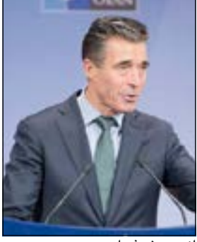
اندرس فوغ راسموسن

وأشار إلى أنه سيستغل زيارته إلى الكويت للاحتفال بالذكرى السنوية العاشرة لتأسيس مبادرة اسطنبول للتعاون التي تعتبر الكويت إحدى الشركاء الأربعة فيها والتي أسست في اسطنبول عام 2004. يذكر أن الكويت عضو في مبادرة اسطنبول للتعاون التي أطلقها الحلف عام 2004 لتوسيع التعاون مع دول الخليج العربي والشرق الأوسط وشمال أفريقيا وتعزيز الأمن والاستقرار.