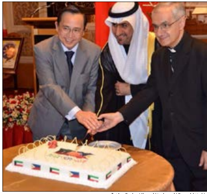
سفارتنا لدى الفلبين احتفلت بالاعياد الوطنية

بروكسل - كونا: اعرب السكرتير العام لحلف شمال الاطلسي (ناتو) اندرس فوغ راسموسن امس عن تطلعه لتعزيز العمل المشترك بين «ناتو» والكويت. وقال راسموسن في تصريح لـ«كونا» في مقر الحلف الاطلسي انه سيبحث خلال زيارته المقررة إلى الكويت الأسبوع المقبل «سبل تعزيز وتقوية العمل المشترك بين «ناتو» والكويت وشركائنا الآخرين من دول مجلس التعاون الخليجي».