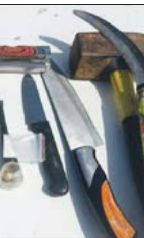
الاسلحة البيضاء المضبوطة بداخل سيارة الوانيت

دخل منطقة القيروان، وبعد مطاردة استمرت نحو ربع ساعة توقف قائد الوانيت على جانب الطريق وترجل منها وانطلق بين المنازل، وبعد توقف رجال النجدة قاموا بمعاينة السيارة وبتفتيشها عثر بداخلها على