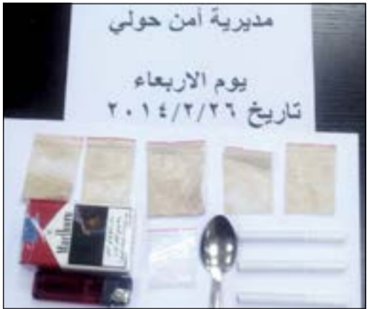
الأكياس الهيروينية الخمسة