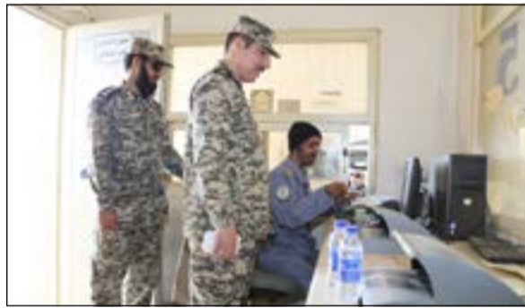
اللواء أنور الياسين خلال تفقده منفذ التوزيع

العاملين فيه وهنأهم بالأعباء الوطنية ونقل لهم تحيات نائب رئيس مجلس الوزراء ووزير الداخلية الشيخ محمد الخالد ووكيل وزارة الداخلية الفريق سليمان الفهد ومعبراً لهم عن شكره وتقديره للجهد المبذولة في أداء عملهم واستمع إلى شرح مفصل عن آلية العمل واعطائهم بعض التوجيهات التي تخدم المغاربة والقادمين عن طريق هذا المنفذ، مطالباً