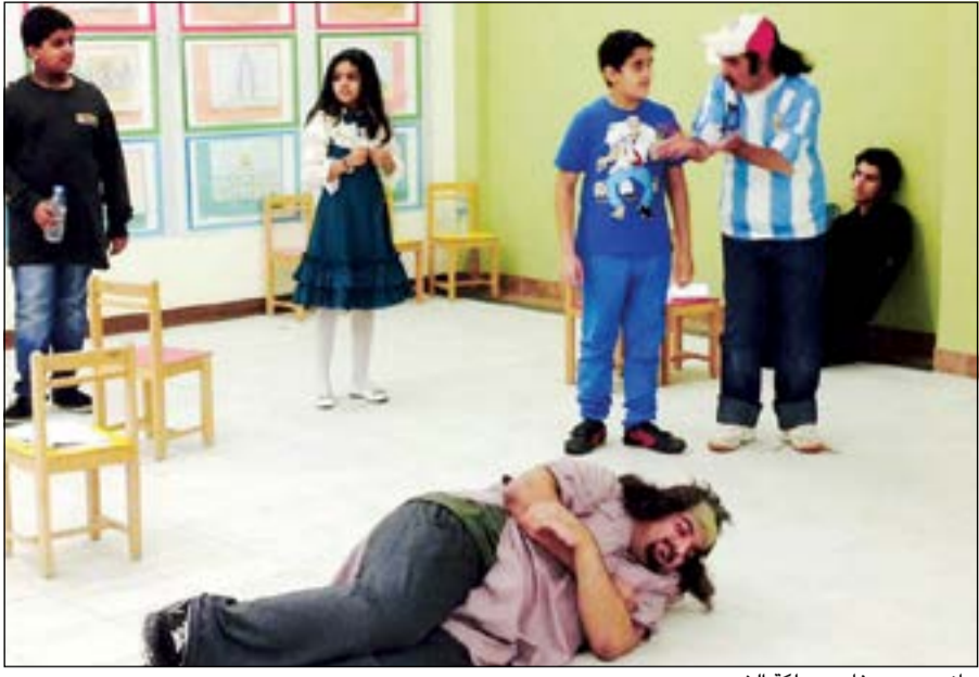
جانبا من بروفات «ملكة الشر»