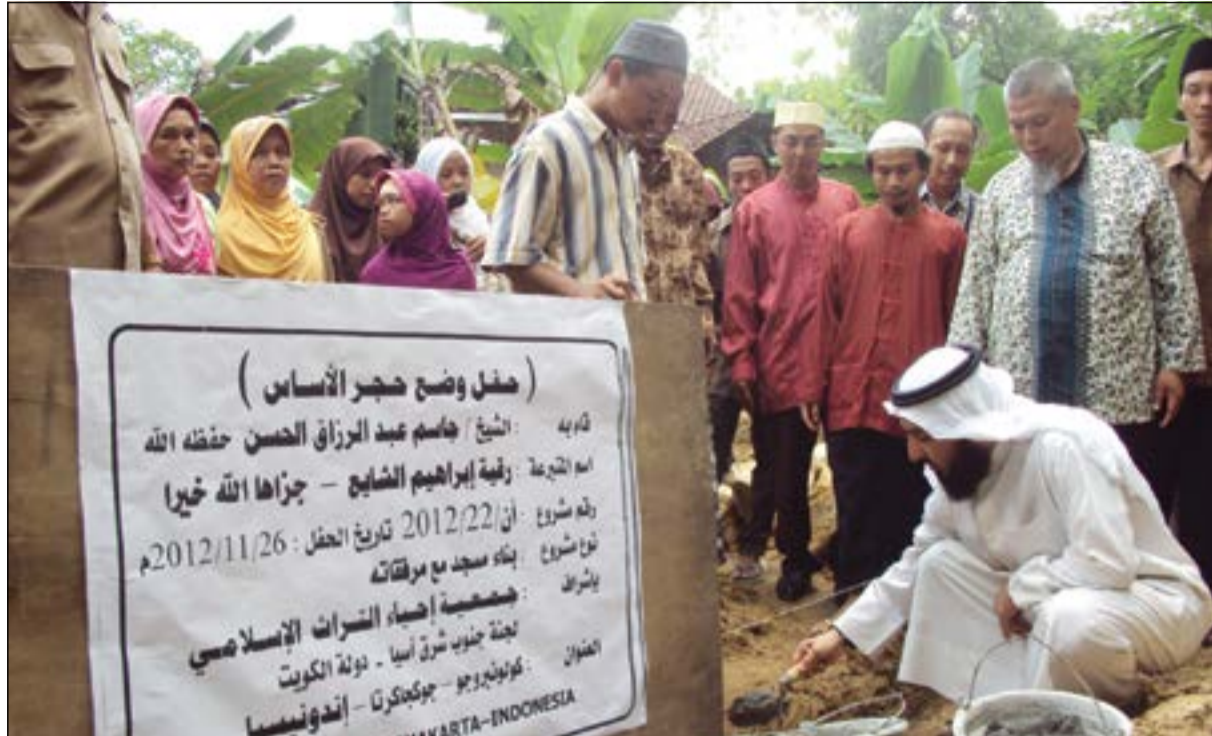
جمعية إحياء التراث الإسلامي