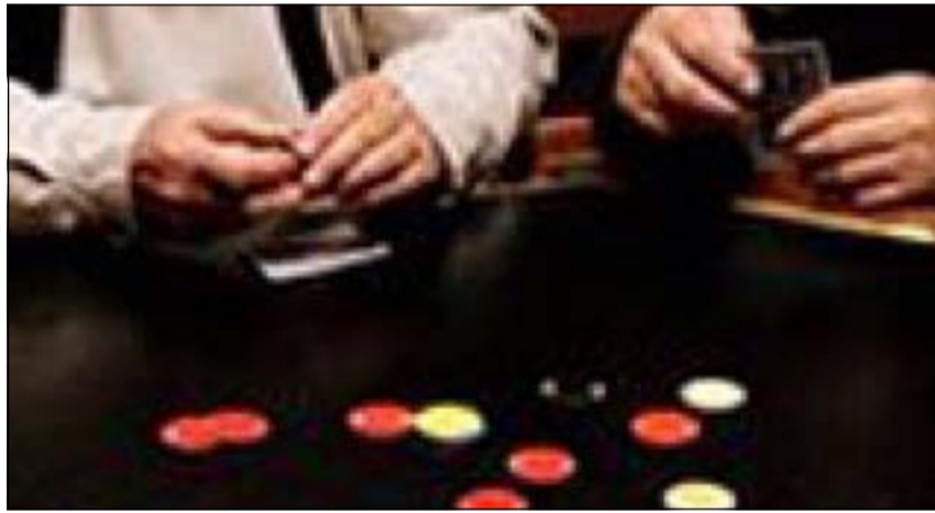
«الأفيش»، وتجهيزات متكاملة داخل الصالة