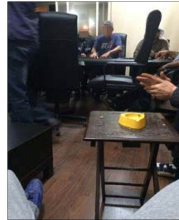
اللاعبون منهمكون وكاميرا المصدر تصوره