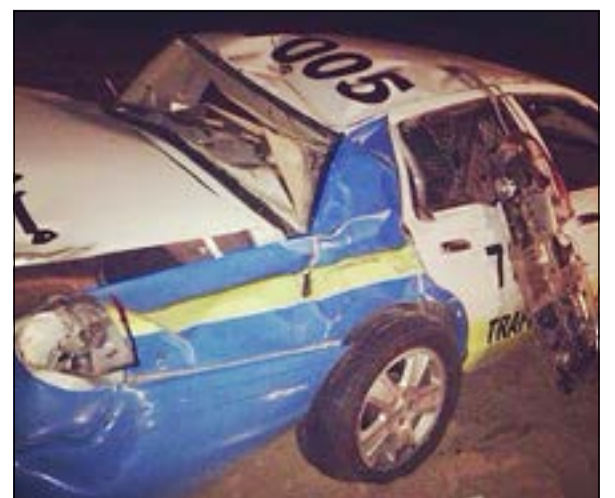
الدورية وقد تعرضت إلى تلفيات بالغة

أصيب عسكري في مرور الجهراء ولحققت بالدورية أضرار بليغة، حيث قال مصدر امسي أن دورية نجدة العبدلي أوقفها شخص وأبلغ من بالدورية بان هناك دورية تتبع المرور معطلة ومهشمة وبها عسكري مصاب. هذا ولم تساعد حالة العسكري المصاب الصحية على الوقوف على ملباسات الحادثة، وهناك ترجيح بان تكون الدورية قد انقلبت.