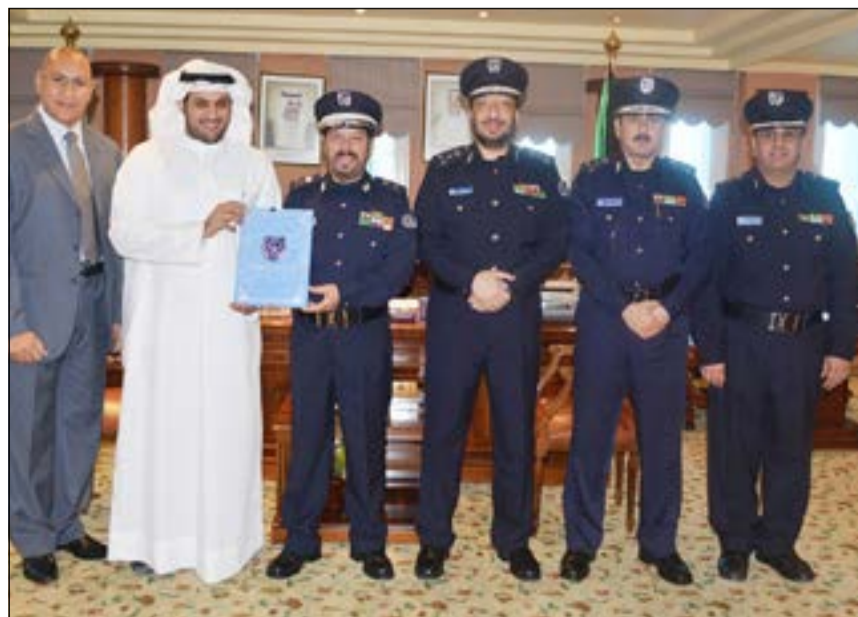
اللواء الأنصاري وقيادات الإطفاء ومسؤولو الشركة عقب توقيع العقد