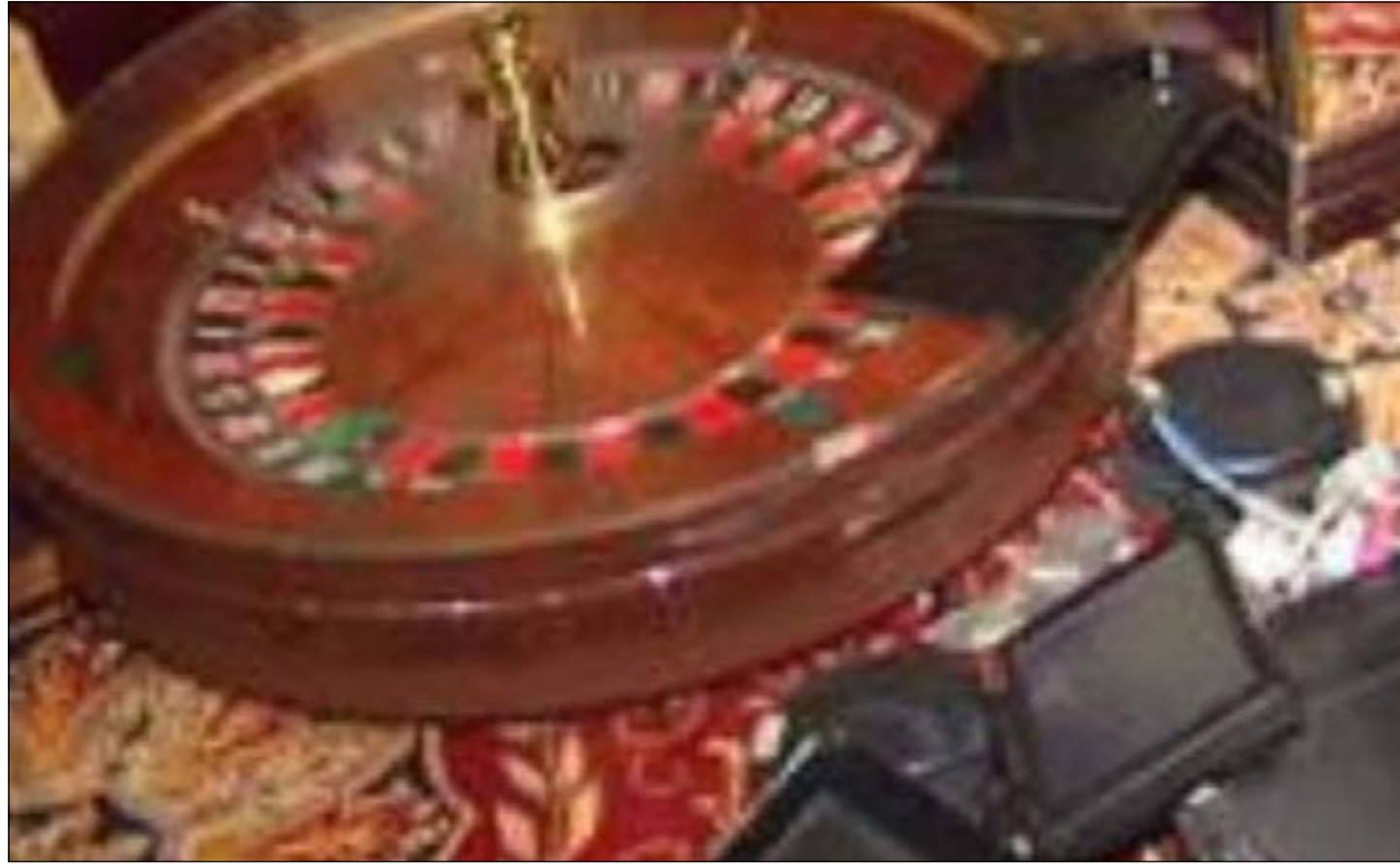
أدوات القمار مستوردة من شركات متخصصة

مباحث الآداب أوقفت بداخله مواطنين وأجانب