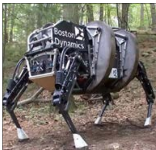
إعداد مني الدغمي

بحلول عام 2029، ستكون أجهزة الكمبيوتر قادرة على فهم لغتنا، والتعلم من خبرة ودهاء وحتى حيل البشر الأكثر ذكاء، وفقا لمدير المهندسين في غوغل راي كورزويل. كورزويل البالغ من العمر 66 عاما لديه نموذج سابق في صنع التنبؤات الدقيقة عن طريق التكنولوجيا وهو أحد المتنبئين الرائدین في العالم والمطوّرین للذكاء الاصطناعي (AI). يقول: في عام 1990 سيكون جهاز الكمبيوتر قادرا على ضرب بطل الشطرنج بحلول عام 1998 - وهو الإنجاز الذي يديره ديب بلو آي بي إم، ضد غاري كاسباروف، في عام 1997. وعندما كانت لا تزال شبكة الإنترنت صغيرة تستخدم من قبل مجموعة صغيرة من الأكاديميين، توقع كورزويل أنه من شأنه أن يجعل من الممكن قريباً ربط العالم كله. الآن، يقول كورزويل بعد 15 سنة ستجوز الروبوتات الإنسان، بعد أن أوفت ما يسمى اختبار تورينج، حيث يمكن لأجهزة الكمبيوتر أن تظهر السلوك الذكي مساوية لتلك التي لدى الإنسان.