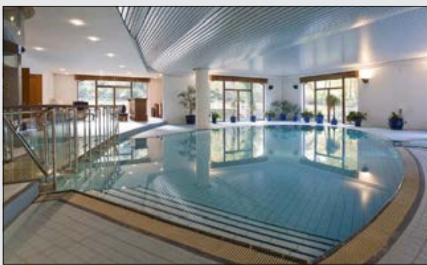
حوض سباحة داخلي في قصر تروباك في جادة الأساقفة في العاصمة البريطانية لندن