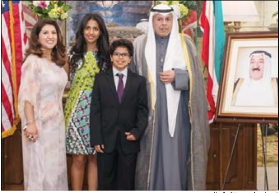
الجيا مع أسرته خلال الحفل