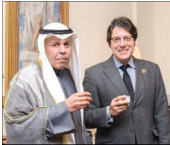
القنصل الجيا وعمدة بفرلي هيلز وقهوة عربية