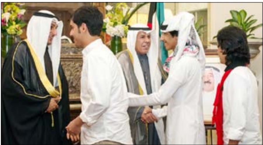
الجيا مستقبلا مجموعة من الطلبة الدارسين باميركا