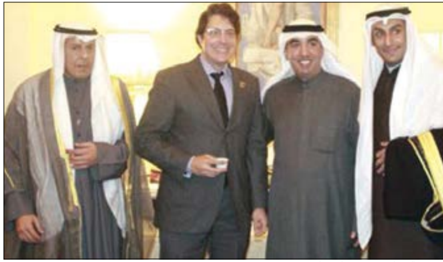
القنصل الجيا مع عمدة بفرلي هيلز