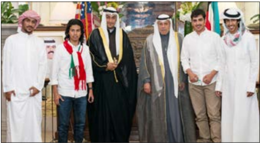
الجيا متوسطا بعض الطلبة