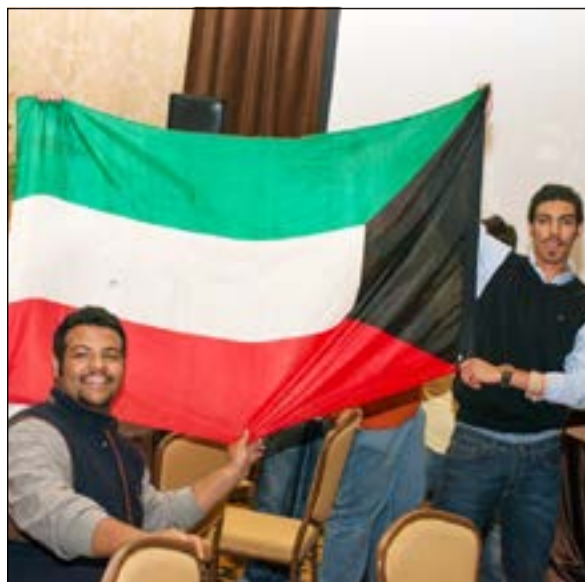
صورة تذكارية مع علم الكويت بالمناسبة