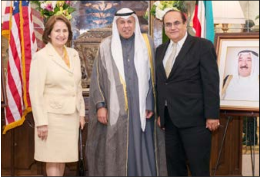
مديرة المراسم لكتب الخارجية في لوس انجليس تقدم التهانى

وأقامت القنصلية العامة للكويت في ولاية لوس انجليس الاميركية أمس حفل استقبال بمناسبة الاحتفال بالذكرى الـ 53 للعيد الوطني والـ 23 ليوم التحرير ومرور ثمانية أعوام على تولي صاحب السمو الامير الشيخ صباح الاحمد مقاليد الحكم. وحضر الحفل عمدة مدينة بفرلي هيلز وأعضاء السلك الدبلوماسي المعتمدة بالمدينة وشخصيات سياسية ومثلي بعض الأحزاب السياسية والمسؤولين الرسميين بمدينة لوس انجليس بالإضافة إلى شخصيات تمثل المجتمع المدني ورجال الاعمال. كما شارك في الحفل عدد كبير من الطلبة الكويتيين الدارسين بالجزء الغربي من