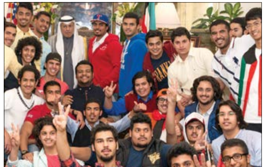
الطلبة الكويتيون في كاليفورنيا