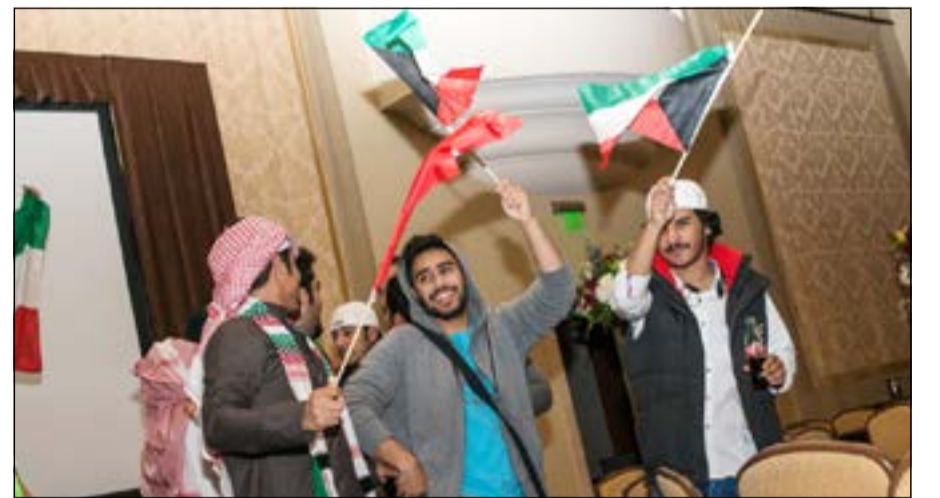
الطلبة يرفعون الاعلام احتفاء بالعيد الوطني