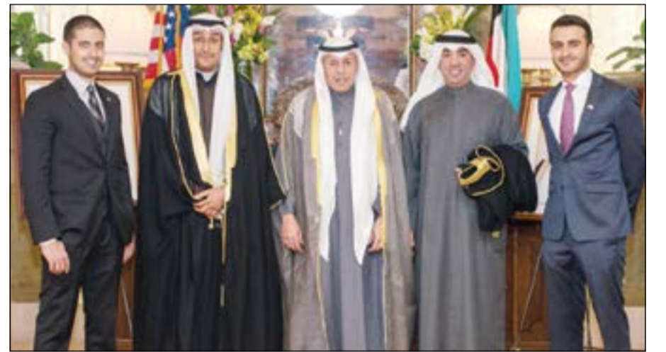
تهنئة بالعيد الوطني