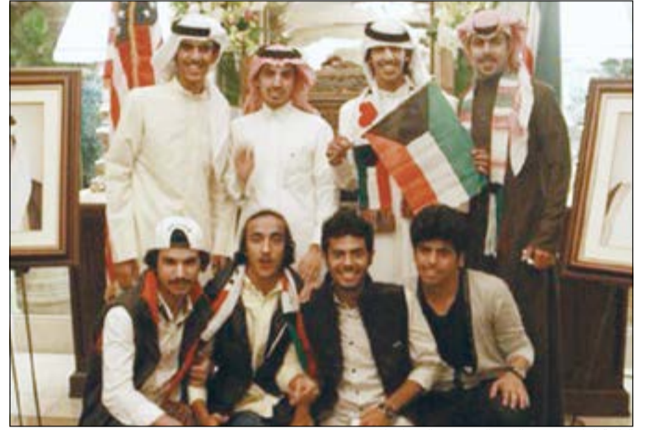
الطلبة الدارسون في الجزء الغربي من الولايات المتحدة

الولايات المتحدة الاميركية. وقد أعرب القنصل العام الكويتي بلوس انجليس السفير عبداللطيف الجيا عن خالص تهانيه وأطيب أمنياته لصاحب السمو الامير الشيخ صباح الاحمد وسمو رئيس مجلس الوزراء الشيخ جابر المبارك والحكومة والشعب الكويتي. متمنيا لبلدنا العزيز ان يزداد عزة وتقدما وازدهارا تحت لواء قيادة صاحب السمو وولي عهده الأمين، داعيا المولى عز وجل أن يحفظ الكويت من كل مكروه ويديم عليها نعمتي الأمن والاستقرار.