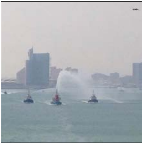
عرض القطع البحرية