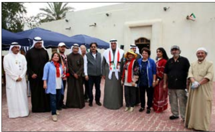
الشيخ سلمان الحمود يتوسط الفنانين التشكيليين في الورشة الفنية «الكويت في عيون التشكيليين»

من جانبه قال الأمين العام المساعد لقطاع المسرح في المجلس الوطني للثقافة والفنون والآداب محمد العسوسى إن هذه الورشة تأتي بناء على توجيهات الشيخ سلمان الحمود بضرورة العمل على مشاركة كل شرائح المجتمع في الاحتفالات بالأعياد الوطنية. لاسيما الفنانين التشكيليين. وأضاف العسوسى أن