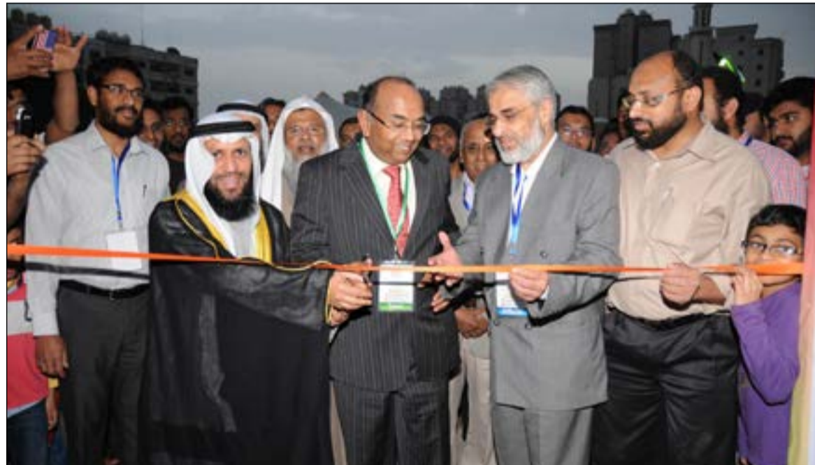
داود العسوسى والسفير الهندي يفتتحان السمينار

بدوره، أكد السفير الهندي سونيل جاين أنه على دراية بالكتاب الهندوسي «باجولجيتا» والذي يدعو إلى الخير للبشرية وعلى الرغم من أنه لا يعرف القرآن، إلا ان ما وجد في المعرض الديني هنا من خلال اللوحات المعروضة أيضاً يدعو إلى الخير للبشرية.