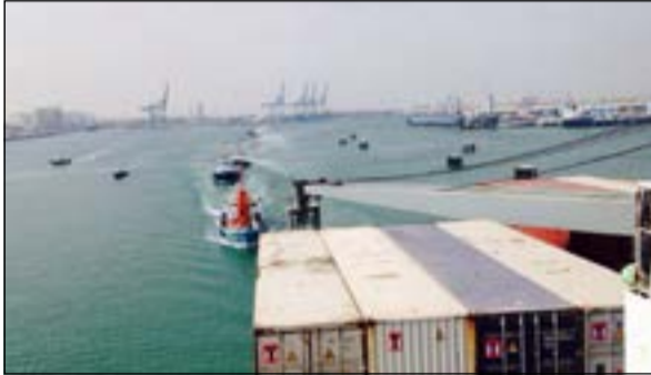
جانب من العرض

في ظل أجواء الاحتفالات الوطنية للكويت، قامت مؤسسة الموائى الكويتية بتنظيم عرض بحري للمشاركة في الاحتفالات عن طريق تنظيم مسيرة استعراضية مكونة من تسع قطع بحرية، بالإضافة إلى ناقله تابعة إلى وزارة المواصلات، وانطلقت المسيرة من الشويخ إلى الجزيرة الخضراء وسط استعراضات بحرية تخللتها عروض مائية جذبت أنظار المتواجدين على شاطئ الخليج.