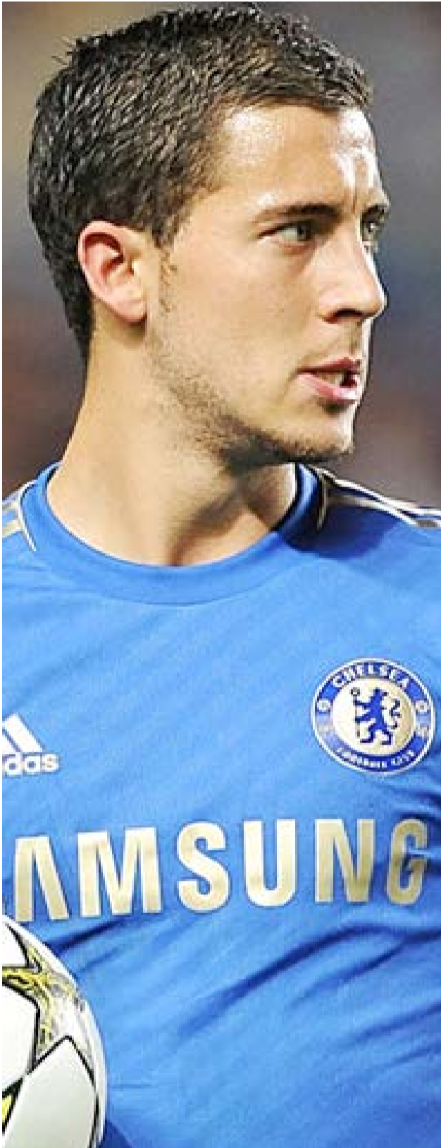
نجم تشلسي إيدن هازارد يطعم بمواصلة التائق والذهاب بعيداً في دوري الأبطال