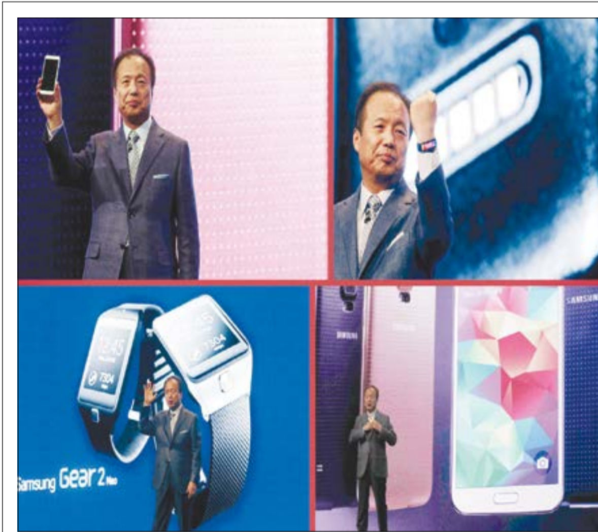
الرئيس ونائبه قسم تكنولوجيا المعلومات بشركة سامسونج جي كي شين يعلن عن إطلاق «غالاكسي S5» خلال المؤتمر العالمي للاتصالات ببرشلونة أمس. حيث كشفت سامسونج أيضا عن أحدث ساعاتها الذكية وسوار ذكي باعتبارهما أحدث الابتكارات التي ستحول استخدام الموبايل من اليد إلى المعصم كما يبدو في الصور المجمععة اعلاه