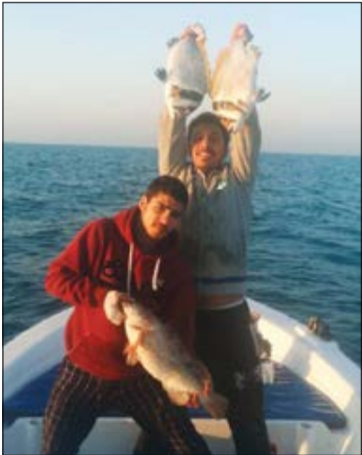
صيدنا فسکر وبول