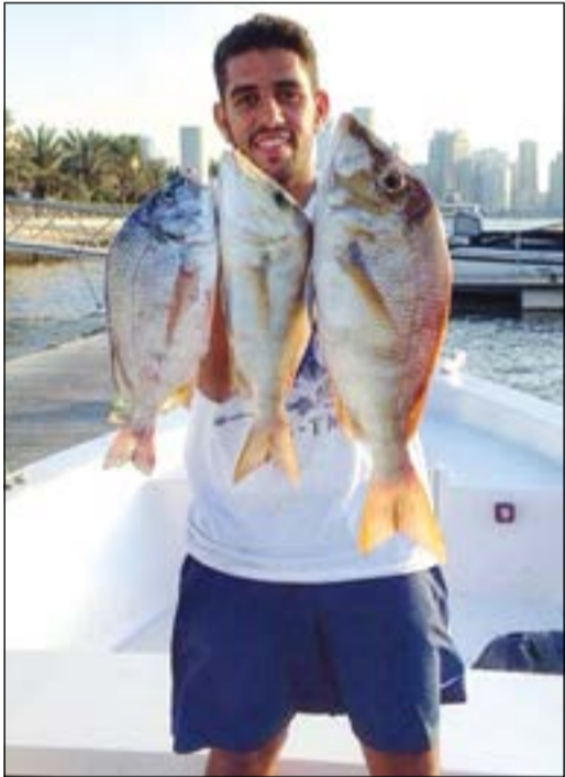
شعري وشعمر روعة