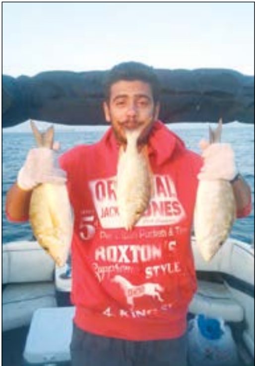
عيش نثري وشعري .. ياسلام