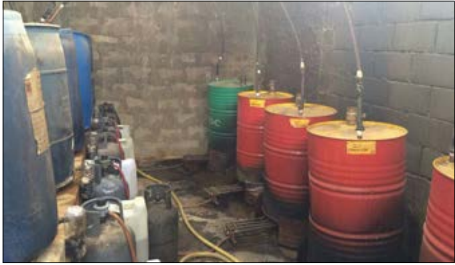
أدوات ومعدات التصنيع