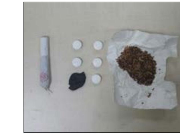
الحشيش والحبوب المضبوطة مع المصري

وقال المصدر: تمكن رجال الامن من السيطرة على السوري وتمكن آخر كان يرافقه من الهرب، وبالإستعلام عن الوافد السوري تبين أنه مطلوب لقضايا سلب، كما أنه مطلوب لقضايا سرقة