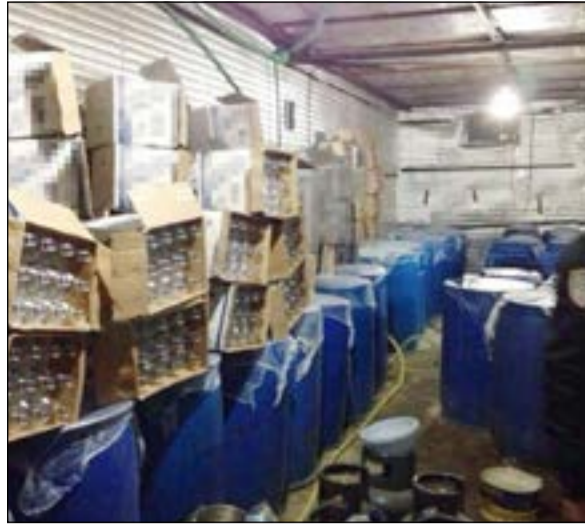
المخزن من الداخل