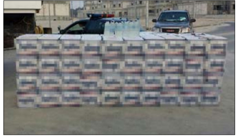
الكراتين المعبأة بالخمور بعد ضبطها