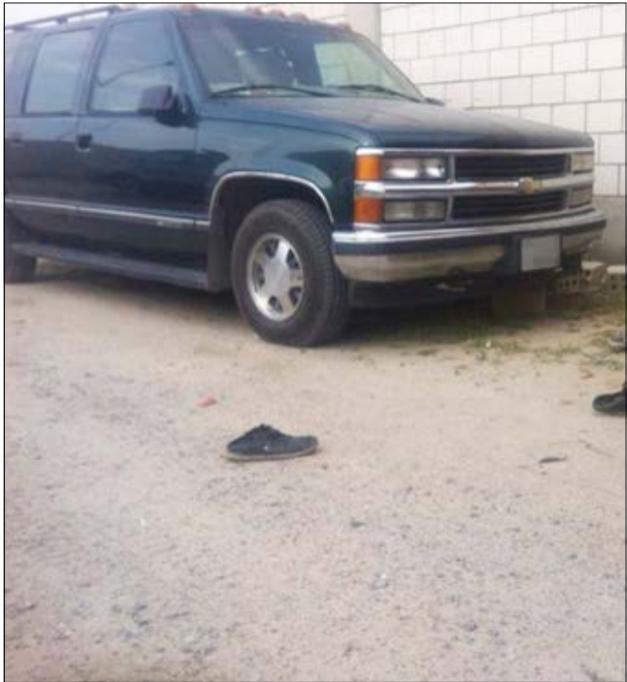
المركبة التي كان السوري وشريكه بصدد سرقتها

أمير زكي - محمد الجلامنة أغلق رجال نجدة العاصمة بقيادة المقدم مشعل الخميس أحد أكبر مصانع الخمور المحلية وتم ضبط القائمين على التصنيع والبيع وهم من جنسية أسبوية. ضبط مصنع الخمور لم يكن هو الأوحد في ضبطية أمس بل تم ضبط تنكر أعد بطريقة فنية لتوزيع الخمور في مناطق عدة.