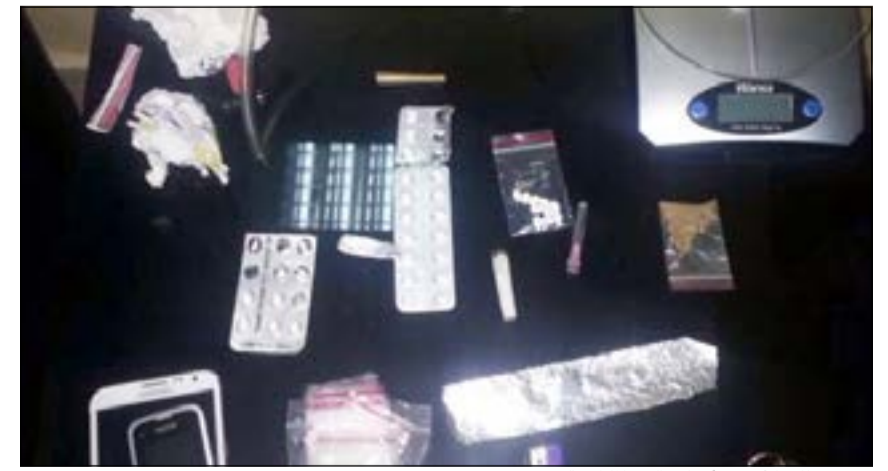
مضبوطات الأردني أحيلت إلى «المكافحة»

وروق رشيد، أما المصري فضبط في منطقة المنقف وعثر بحوزته على ورقة بها حشيش إلى جانب 5 حبات. من جهة أخرى استوقفت دورية أمن تابعة لمديرية امن حولي في ساعة متأخرة مساء أمس الأول وافدا من الجنسية العربية كان يقود مركبته بشكل مشبوه الأمر الذي اضطر رجال الأمن