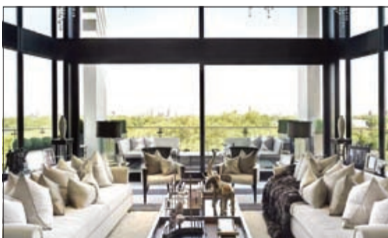
صالة الشقة المليونية