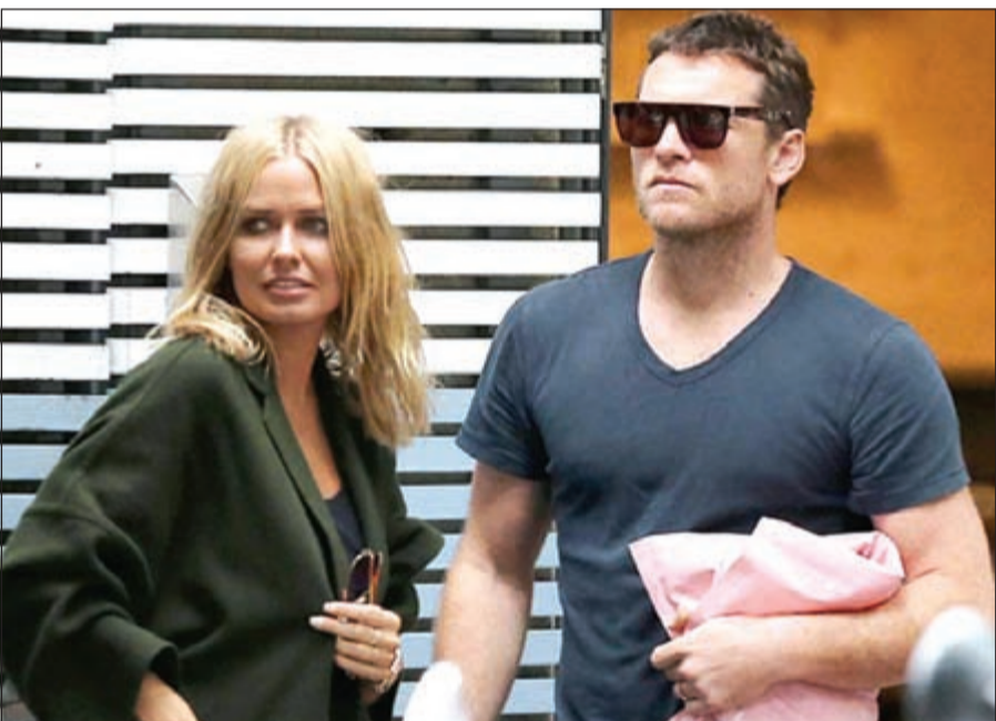
سام وورثينغتون وصديقتة

لوس أنجليس - يو.بي.اي: أعلنت الشرطة الأمريكية عن توقيف نجم أفاتار، سام وورثينغتون، جراء لكمة مصور بابارتزي أقدم على ركل حبيته في نيويورك. ونقل موقع «تي أم زي» الأميركي عن الشرطة، قولها أن، وورثينغتون، وحبيته، لارا بينغل، كانا يخرجان من حانة في غرب نيويورك، عندما أقدم مصور بابارتزي على ركل بينغل لسبب ما.