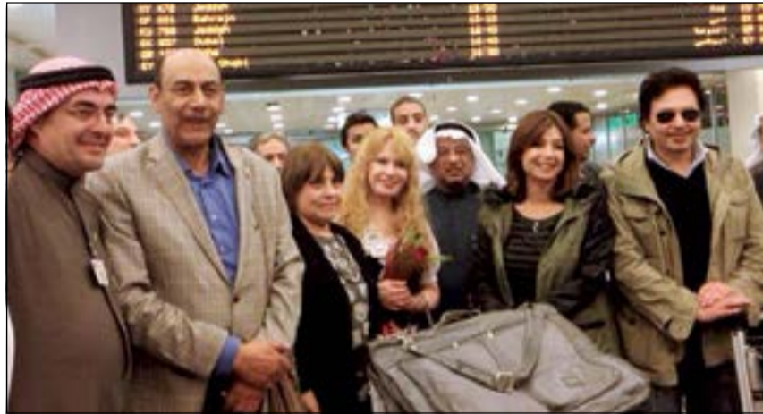
صورة للوفد المصري في مطار الكويت يتوسطهم رئيس بيت الكويت للأعمال الوطنية يوسف العميري