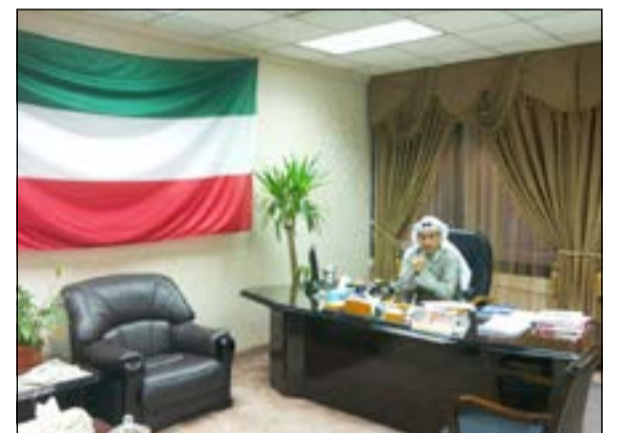
رئيس قسم الملفات في وزارة الصحة عبدالعزيز التركيت يزين مكتبه بأعلام الكويت