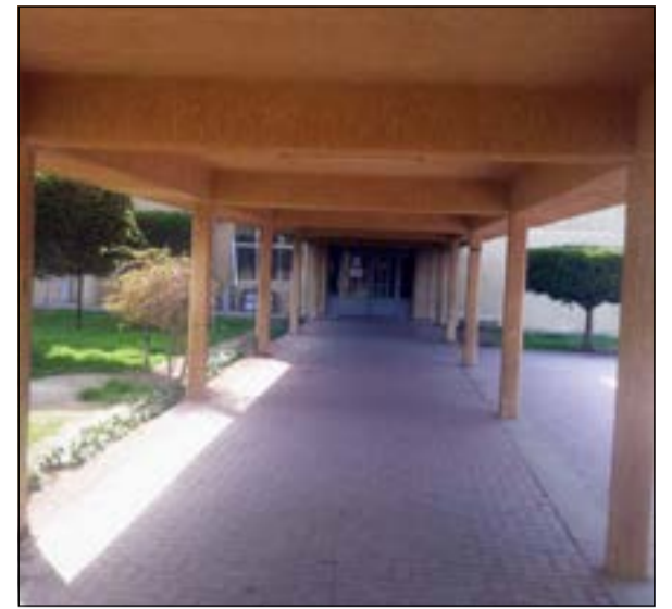
الممرات الخارجية لكليات ومعاهد التطبيقي لم تشهد أي حضور