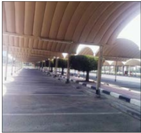
المواقف لم تجد من يبحث عن موقف لسيارته