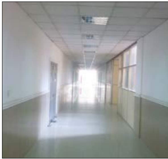
أحد الممرات خال تماما من الطلبة وأعضاء هيئة التدريس في التطبيقي