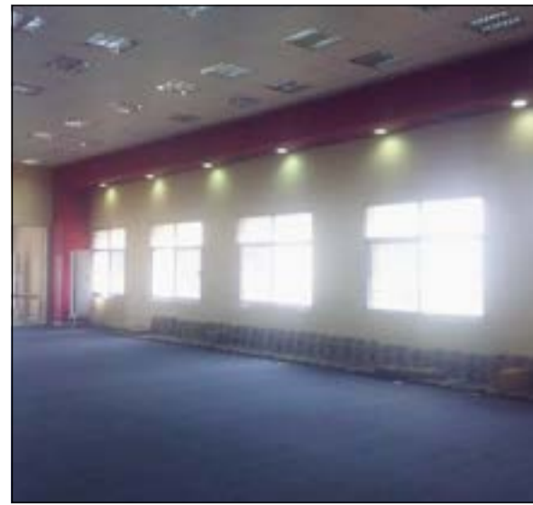
لا توجد أمام قاعات الدراسة