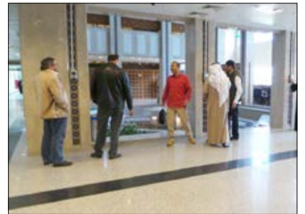
مطقة البصمة لم تشهد زحاما كالمعتاد

قبل عطلة الأعياد الوطنية بيومين، شهدت وزارة الصحة