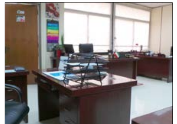
أحد مكاتب وزارة الصحة خال من موظفيه بعد الظهر

حضوراً خجولاً من قبل المراجعين، مع تخفيف نسبي للموظفين في الوزارة، ورغم جميع القرارات التي اتخذتها سابقاً لردع الغياب في الأيام التي تسبق أو تلي الإجازات الرسمية، إلا أن الوزارة كالمعتاد اتسمت بهدوء نوعي أمس. وقام عدد من الموظفين بتزيين مكاتبهم بأعلام الكويت، وصور صاحب السمو وسمو ولي العهد. وعن الدوام، قال عدد من الموظفين لـ «الأنباء»: عدم غيابنا عن الدوام يأتي لخدمة المراجعين، الذين كان حضورهم قليلاً أمس مقارنة بالأيام الأخرى.