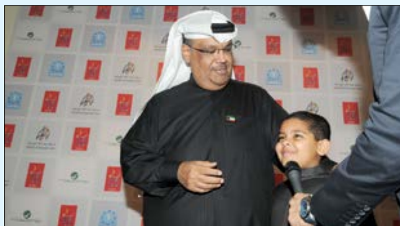
.. ومتحدثا عن الحفل