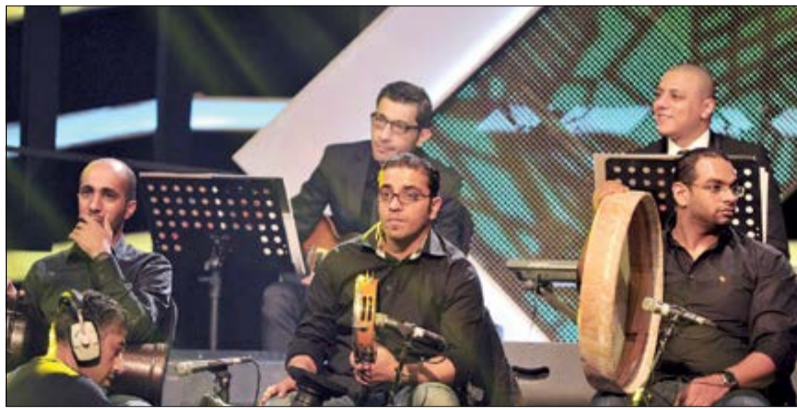
جانبا من الفرقة الموسيقية أثناء الحفل