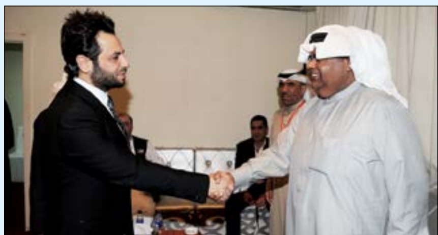
المحن القدير أنور عبدالله مرحبا بنيشان