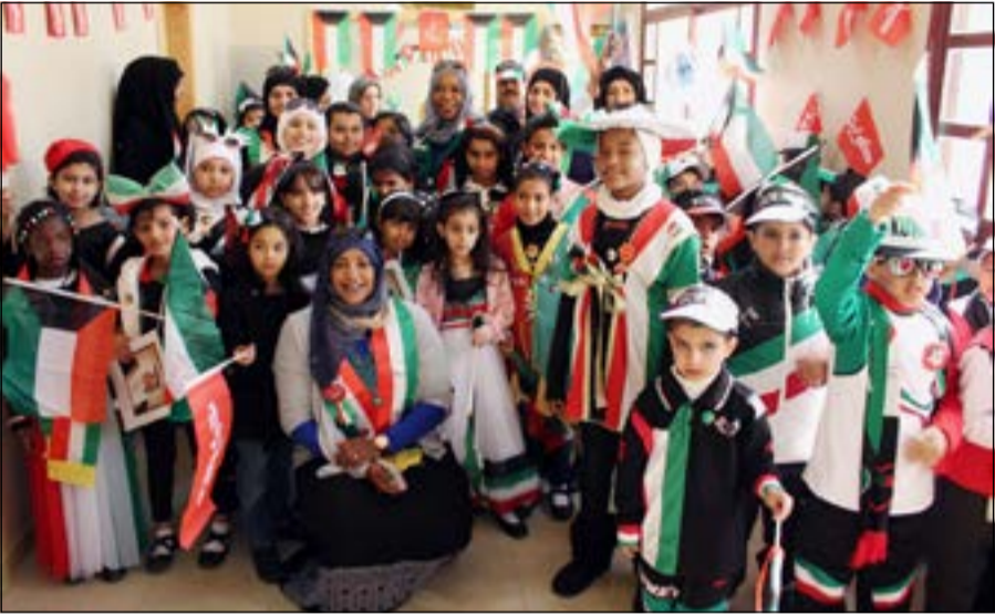
عدد من المعلمين والطلبة والطالبات يتشجون بأعلام الكويت

وصرحت هيا الدوسري بأن أنشطة الحملة تضمنت المرور على جميع مكاتب منطقة الأحمدي التعليمية وتوزيع الأعلام والباجات على المعلمين بالمنطقة والمرجعين، وذلك لتعزيز الروح الوطنية وإحياء الحس الوطني لدى الجميع مشاركة من إدارة الأنشطة التربوية للدولة احتفالاً بالأيام الوطنية الجديدة، ودامت الكويت دار أمن وأمان.