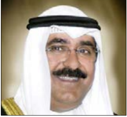
الشيخ مشعل الأحمد

صباح الأحد وسمو ولي العهد الشيخ نواف الأحمد وقادة قوات الحرس الوطني بمناسبة احتفالات الكويت بمرور 53 عاماً على الاستقلال و23 عاماً على التحرير و8 أعوام على تولي صاحب السمو الأمير مقاليد الحكم في البلاد. وذكر أن القيادة دعت المولى عز وجل أن يعيد هذه المناسبات السعيدة على الجميع بالخير واليمن والبركات وأن يديم على ربوع الوطن الغالي نعمتي الأمن والأمان في ظل قيادته الحكيمة.