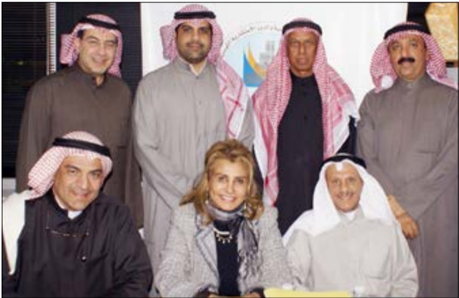
السلطان متوسطا اعضاء اتحاد المكاتب

وأضاف السلطان: ان الاتحاد وبالتعاون مع وزارة الكهرباء والماء سيعقد ورشة عمل خاصة من أجل تفعيل الاجراءات التنفيذية وتدريب المهندسين المعتمدين لربط التيار الكهربائي إلكترونياً من خلال الاتفاق الذي وقع مع وزارة الكهرباء والماء للتسريع في إيصال التيار من خلال المكاتب المرخصة لذلك، ما سيسرع من الدورة المستندية لإنجاز المشاريع، كما ستقام ورشة عمل لتشرح تطبيقات لوائح الجديدة للكهرباء والتكليف لتوفير الطاقة. وقال السلطان ان الاتحاد سيعقد أيضاً في منتصف مارس المقبل ورشة عمل خاصة حول دور المكاتب الاستشارية في التنمية والمعوقات التي تواجهها في التنمية بمشاركة عدد من المخصصين وذلك بالتزامن مع الحفل التكريمي الخاص الذي سيقامه الاتحاد للداعمين لأنشطة وفعاليات المكاتب الهندسية والدور الاستشارية الكويتية.