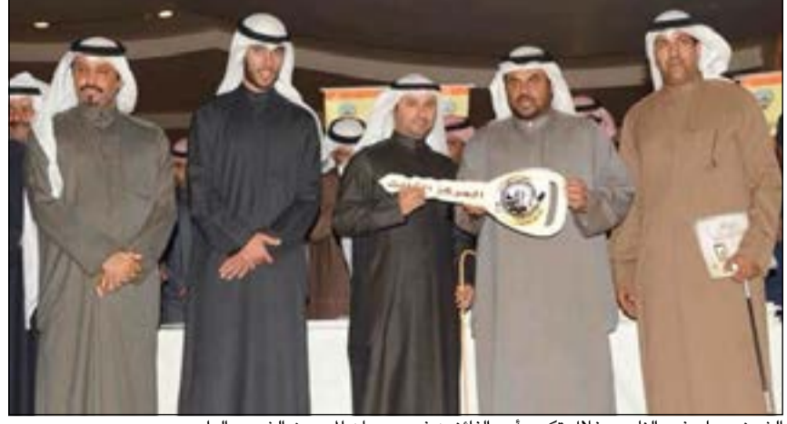
الشيخ صباح فهد الناصر خلال تكريم أحد الفائزين في مهرجان الموروث الشعبي الرابع

سباق مراثون الهجن إضافة الى السباقات الخاصة للخيل (جمال وسرعة وقدره وتحمل). وبين الشيخ صباح الفهد أن المهرجان تضمن أيضاً إقامة مسابقات للمصقور (سرعة وجمال) لكل الأنواع إضافة الى مسابقات الجمال والمراج للأغنام في عدة أنواع، كما أقيمت مسابقات متعلقة بالموروث البحري وشملت إقامة أربع مسابقات لصيد الاسماك أهمها المسابقة الكبرى على جائزة سمو الامير للخبزة.