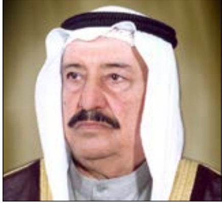
سمو الشيخ سالم العلي

صباح الأحد وسمو ولي العهد الشيخ نواف الأحمد وقادة قوات الحرس الوطني بمناسبة احتفالات الكويت بمرور 53 عاماً على الاستقلال و23 عاماً على التحرير و8 أعوام على تولي صاحب السمو الأمير مقاليد الحكم في البلاد. وذكر أن القيادة دعت المولى عز وجل أن يعيد هذه المناسبات السعيدة على الجميع بالخير واليمن والبركات وأن يديم على ربوع الوطن الغالي نعمتي الأمن والأمان في ظل قيادته الحكيمة.