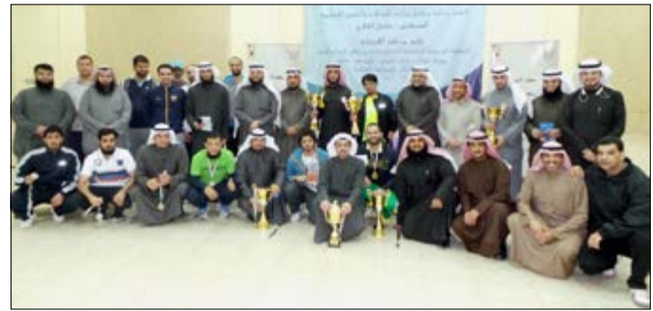
مجموعة من المشاركين في البطولة