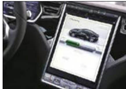
سيارة تسلا أثناء شحنها بالكهرباء في إحدى محطات الوقود بالمانيا