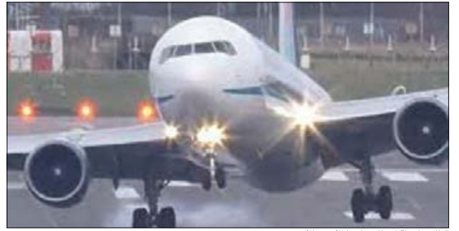
الطائرة لحظة ارتطام جانبها بالأرض

ديسي - العربية.نت: إن كنت تخشى من الطيران.. فلا تشاهد مقطع الفيديو المروع هذا، حيث ينقل المقطع الذي حمل على «يوتيوب» الأحد الماضي، وشوهد أكثر من 3 ملايين مرة حتى الآن، معاناة طائرة للهبوط في مطار برمينغهام ببريطانيا وسط رياح شديدة. ويظهر الفيديو الطائرة، وهي من طراز «بوينغ 767»، وهي تتأرجح بشكل مهول من شدة الرياح، حيث وصلت حينها سرعة الرياح التي كانت تضرب الطائرة من الجانب إلى 64 كلم بالساعة. ويبرز المقطع أيضا مهارة الطيار في تفادي كارثة محققة والهبوط بسلام، حيث بقي محكما السيطرة على الطائرة وجعلها تهبط بانحدار