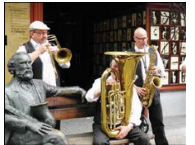
تمثال أدولف ساكس ويجواره عازفون

بروكسل - وكالات مع أن البلجيكي أدولف ساكس، أعطى اسمه آلة الساكسوفون، وهو اختراع أحدث ثورة في عالم الموسيقى، لاسيما في مجال الجاز والبلوز، فإنه