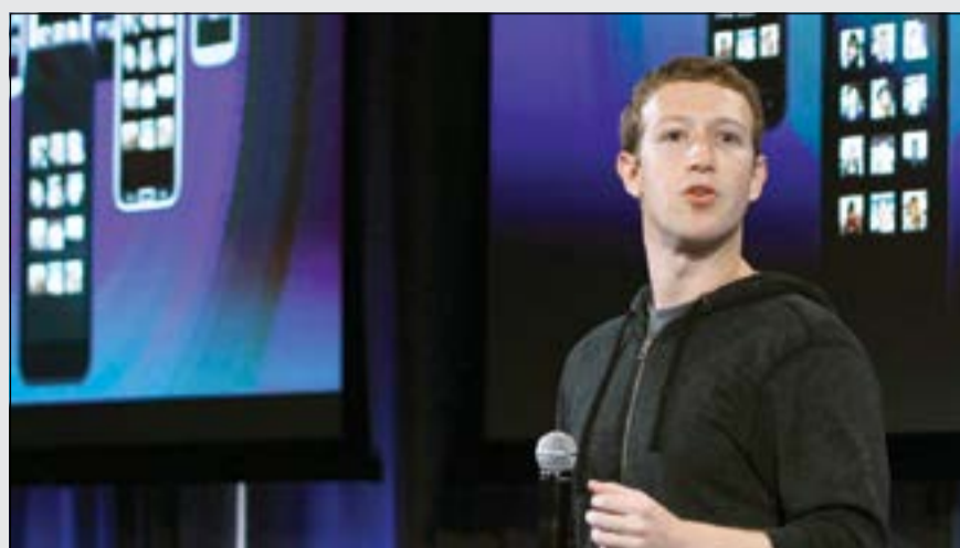
مارك زوكربيرغ مؤسس «فيسبوك»، ورئيسها التنفيذي متحدثاً عن مستقبل الشركة، حيث قامت فيسبوك بالاعلان عن استحوادها على واتساب بقيمة 19 مليار دولار (رويترز)