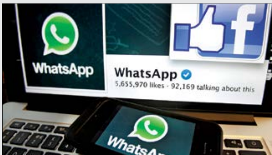
شعار فيسبوك و«واتساب» يظهران على شاشة الكمبيوتر المحمول امس في باريس، حيث تسعى فيسبوك لجلب شريحة كبيرة من المستخدمين الأصغر سناً عبر استحوادها على «واتساب»

آخر أخبار الاقتصاد المحلية والعالمية زوروا موقعنا على www.alanba.com.kw/Business