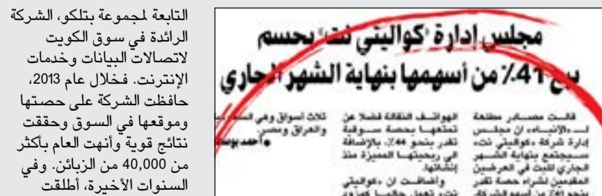
..وصورة من خبر «الانباء» المنشور في 22 أكتوبر الماضي

المضنية، نجحت شركة كواليتي نت في تكوين فريق عمل من الموظفين بقيادة تنفيذيين من ذوي الخبرة الذين سعوا بكل جد من أجل تقديم خدمة موثوقة لزبائن الشركة». وأضاف لدينا خطط للعمل عن قرب مع إدارة شركة كواليتي نت لتنفيذ عدد من البرامج الاستراتيجية من أجل