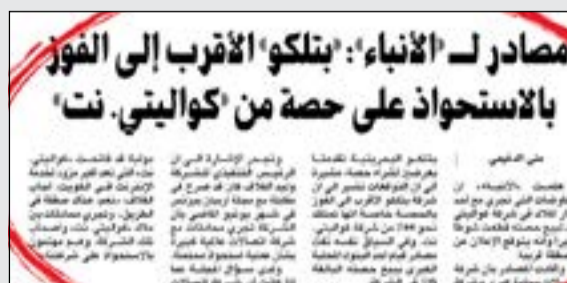
صورة من خبر «الانباء» المنشور في 17 أكتوبر الماضي

من الشروط المسبقة، غير أن الإنجاز الكامل لهذا الاتفاق يتوقع له أن يتم خلال شهر مارس 2014. وأوضح الشيخ حمد قائلاً إن إدارة وتحسين المحفظة الاستثمارية هي جزء من استراتيجية النمو لمجموعة بتلكو. وأضاف أن زيادة الحصص المساهمة في الشركات القائمة بمجموعة