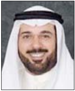
الحمامي علي العصفور

أحيل مواطن إلى نيابة الاحمدى يوم أمس لإعادة التحقيق معه وتصنيف القضية التي سيجال بشأنها ما إذا كانت ستسجل كقتل عمد أم ضرب أفضى إلى