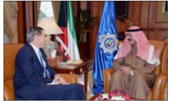
الشيخ محمد الخالد والسفير الأميركي

المتعلقة بالشأن الأمني. ومن جانبه أعرب السفير الأميركي عن سعادته بهذه الزيارة وما تم مناقشته في سبيل تعزيز العلاقات بين البلدين. كما استقبل الشيخ محمد الخالد سفير جمهورية ألمانيا الاتحادية لدى دولة الكويت أوجين فولغارت وقد رحب به مشيداً بالتعاون والتنسيق بين البلدين.