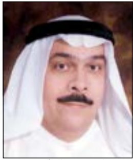
المستشار نصر سالم آل هيد