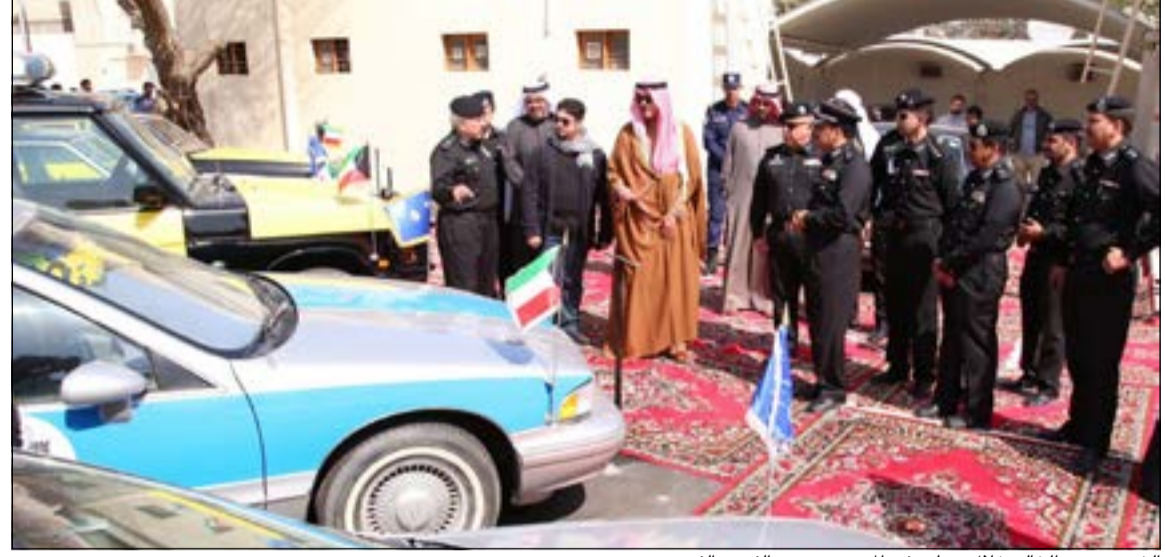
الشيخ محمد الخالد خلال جولته في المعرض ويبدو الفريق الفهد

برعاية وحضور نائب رئيس مجلس الوزراء ووزير الداخلية الشيخ محمد الخالد افتتح صباح أمس متحف وزارة الداخلية بمنطقة بنيد القار خلف قصر الشيخ مبارك العبدالله الجابر الصباح.