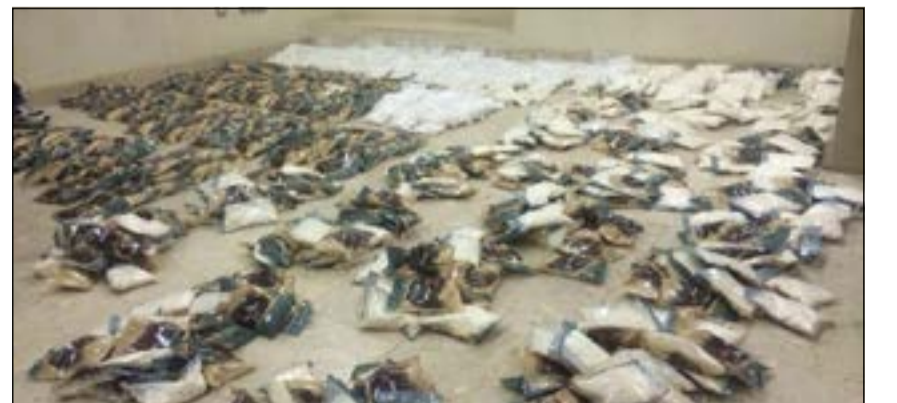
الحبوب التي تم ضبطها في سيارة الهارب

الأمن على عدد 6 حقائب وتبين من تفحصها احتواؤها على كمية ضخمة من حبوب المخدرات الكابتغون مخبأة في أكياس صغيرة. وتمت إحالة القضية إلى الإدارة العامة لمكافحة المخدرات للاستعلام عن المركبة ومعرفة هوية صاحبها للوقوف على مصدر هذه الحبوب. من جهة أخرى، أحال رجال