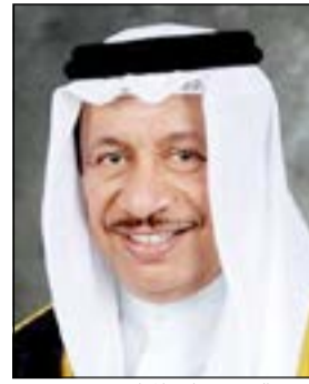
سمو الشيخ جابر المبارك