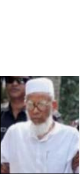
الراحل أبوالكلام يوسف

نعت الهيئة الخيرية الإسلامية العالمية - رئيساً وأعضاء مجلس إدارة وعاملين - عضو جمعيتها العامة المفكر الإسلامي أبوالكلام محمد يوسف الذي وافته المنية يوم الأحد 9 يناير الماضي 2014 في أحد مستشفيات دكا عن عمر يناهز 88 عاماً إثر تعرضه لأزمة قلبية، سائلين الله له الرحمة والمغفرة. والشيخ أبوالكلام عالم جليل وشخصية إسلامية وخيرية بارزة، أسس جمعية الفلاحين الخيرية بنغلاديش عام 1977 كجمعية غير ربحية، وكان من أهم أهدافها تقديم المساعدة المالية للفلاحين الفقراء بوصفهم