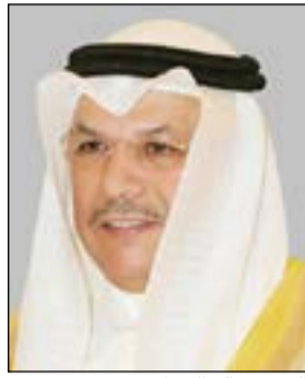
الشيخ خالد الجراح