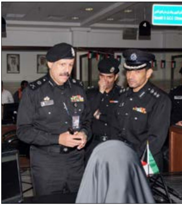
الواء فيصل النواف متحدثا مع إحدى الموظفات