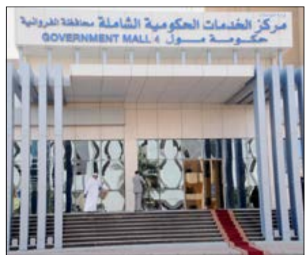
مركز الحكومة مول في منطقة الجليب

التصوير، أما الدور الأرضي فيضم صالون إحداهما لوزارة الداخلية والأخرى تضم عدة جهات حكومية، كما يضم الدور الأول عددا من الجهات والمؤسسات الحكومية، في حين تم تخصيص الدور الثاني بالكامل لوزارة العدل نظرا لتنوع خدماتها، لافتا إلى أن عدد الجهات والمؤسسات المشاركة يبلغ حوالي 20 جهة تقدم خدماتها مباشرة للجمهور في مكان واحد، مما يوفر الوقت والجهد على المراجعين لإنجاز معاملاتهم بسهولة. بدوره، أشار رئيس الجهاز المركزي لتكنولوجيا المعلومات عبد اللطيف السريع بافتتاح الحكومة مول الفروانية، مشيرا إلى أن الجهاز أشرف على عملية الربط بين الجهات الحكومية من خلال شبكة الكويت للمعلومات مبينا أن الشبكة قد ربطت سابقا 56 جهة حكومية وأوضح أن قسم الجهاز المركزي موجود بجانب الخدمات الحكومية الأخرى لخدمة المواطنين والمقيمين الذين يريدون إنهاء خدماتهم إلكترونيا من غير الذهاب إلى الجهاز السريع وبيّن السريع أن البوابة الإلكترونية شملت 830 خدمة حكومية إلكترونية على البوابة الرسمية لافتا إلى أن الجهاز وفر هذه الخدمات من خلال الخدمات الحكومية الشاملة بطريقة أون لاين.