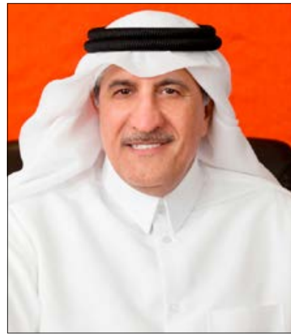
الشيخ عبدالله آل ثاني

استقرت قاعدة عملاء تونسiana في ختام سنة 2013 على 7,4 ملايين عميل مما يشير إلى زيادة عدد العملاء بنسبة 3,2% مقارنة مع الفترة نفسها من سنة 2012. وصلت إيرادات سنة 2013 إلى 195,2 مليون دينار (691,8 مليون دولار) مقارنة مع الإيرادات المحققة للفترة نفسها من سنة 2012 والبالغة