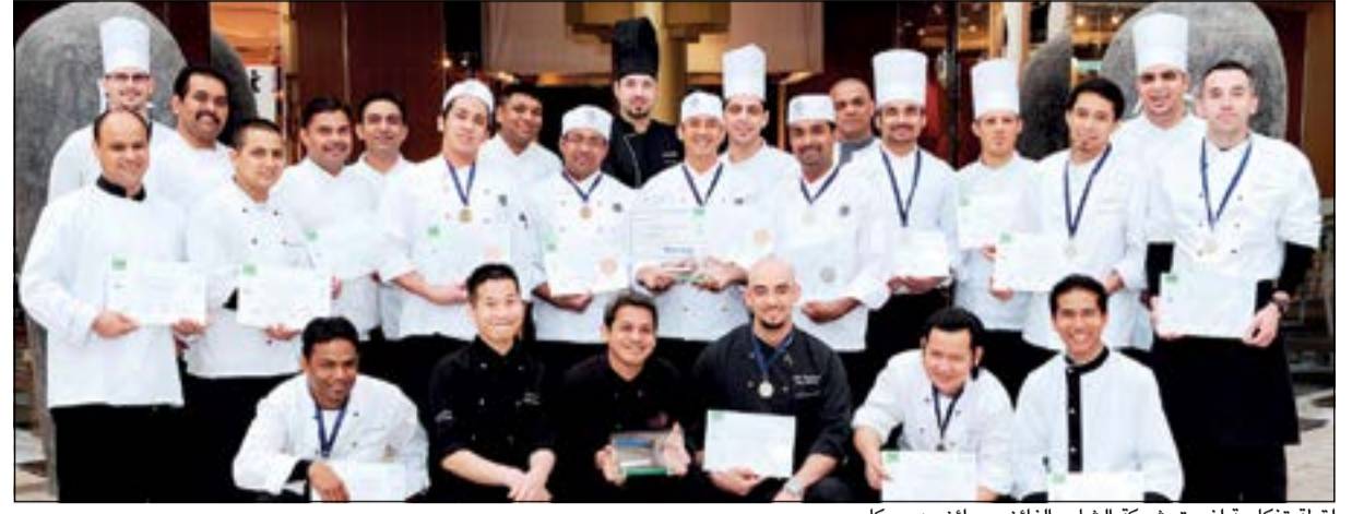
لقطة تذكارية لفريق شركة الشاي الفائز بجوائز «هوريك»

ويعكس هذا الفوز مدى التزام شركة الشاي بتقديم تجارب تناول الطعام لرايائها وفق أرقى المستويات العالمية، كما يعد هذا الفوز تقدماً ملحوظاً بعد الفوز الذي حققته المطاعم التي تديرها شركة الشاي في مسابقة العام الماضي بأربع جوائز. وقد فاز مطعم «دين آند ديلوكا» بخمس جوائز، منها الجائزة الذهبية عن فئة طهي السوشي، كما تم تكريم مطعمين جديدين تديرهما شركة الشاي وهما «كاتسويا-ستارك» و«فيراندا» في محل «هارفي نيكولز» لتميزهما في الطهي، فقد فاز مطعم «كاتسويا» الذي