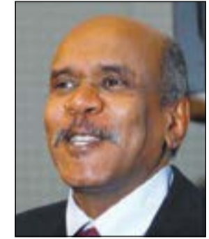
د.الفاتح بابكر الطاهر

نظمتها مؤسسة الكويت للتقدم العلمي محاضرة علمية في مسرح المؤسسة تحدث فيها د.الفاتح بابكر الطاهر الفائز بجائزة الكويت لعام 1999 في مجال العلوم التطبيقية «التغيرات المناخية» بعنوان «تأثير التغيرات المناخية في العالم العربي ومنطقة الخليج». وبدوره أكد د.طاهر الصحاف استاذ الهندسة الكيميائية في جامعة الكويت ومدير مكتب الجوائز بمؤسسة التقدم العلمي ان هذه المحاضرة تعتبر مهمة لدولة الكويت بخصوص التغيير